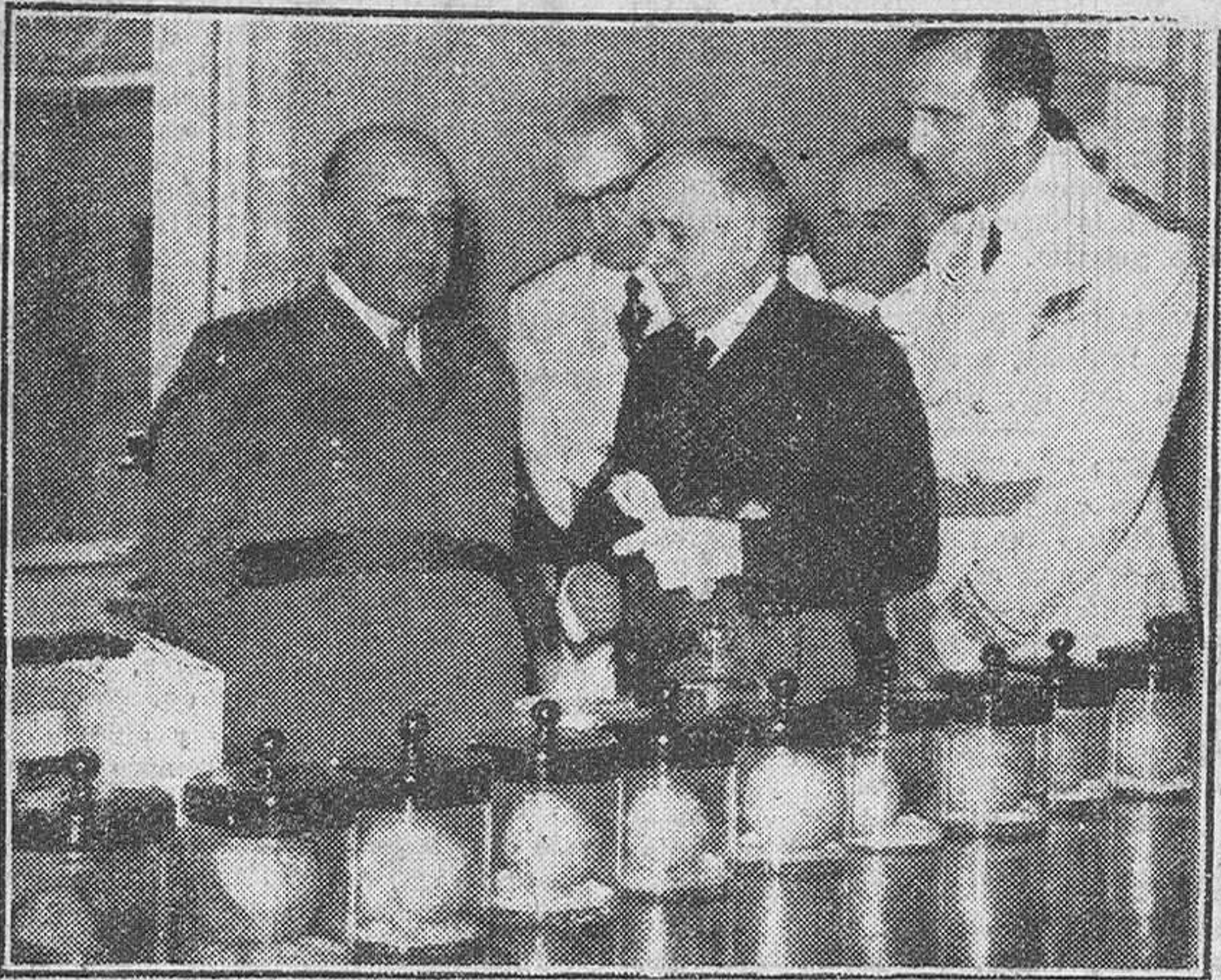
Madrid. — S. E. el Jefe del Estado, durante la inauguración del nuevo edificio del Instituto Nacional de Investigaciones Agronómicas, dependiente del Ministerio de Agricultura, en la Avenida de Puerta de Hierro, de la Ciudad Universitaria.