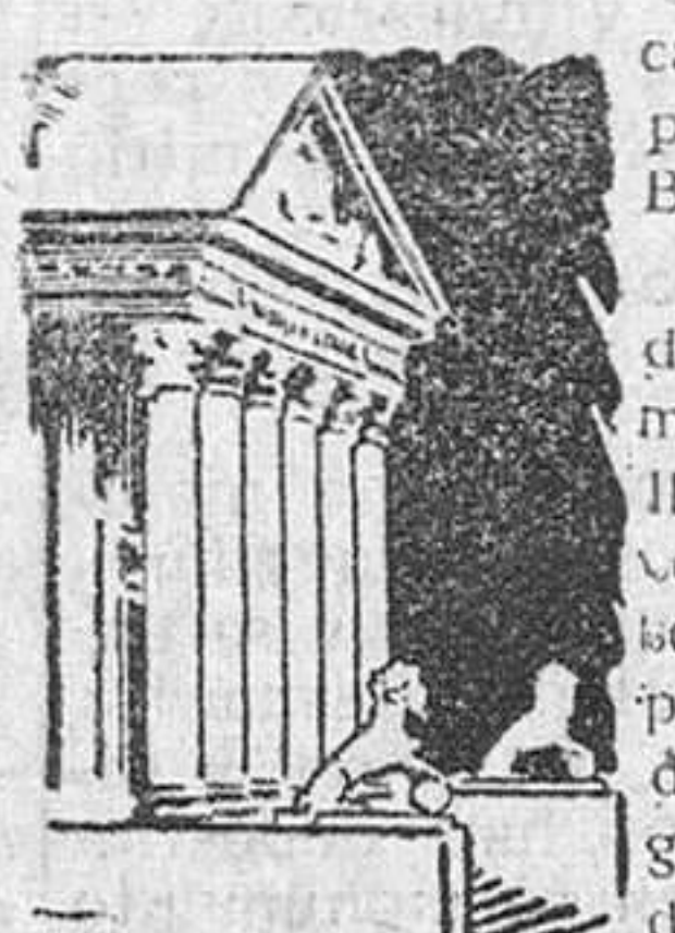
Carta de Madrid