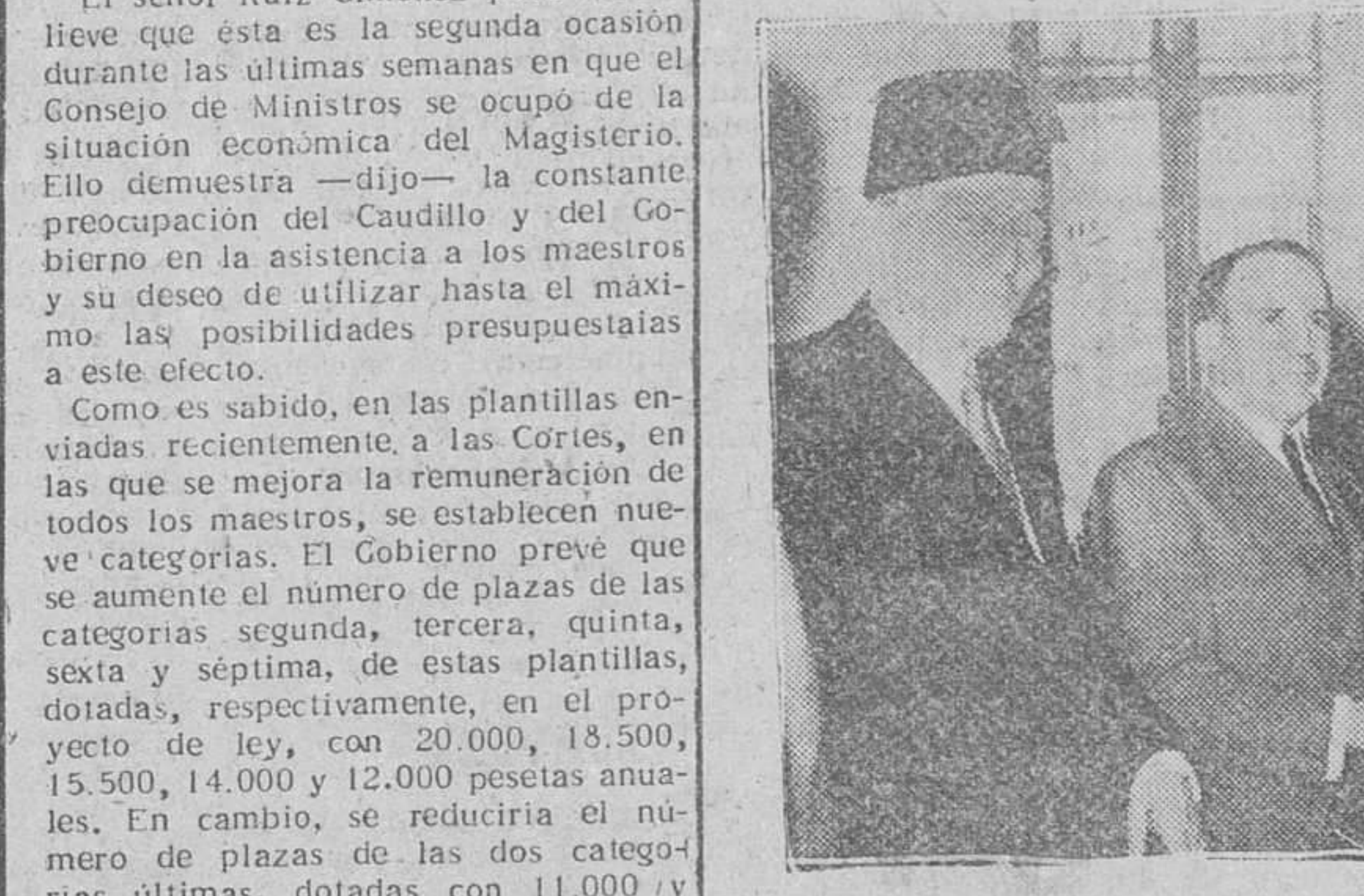
Jerusalén. — El embajador de España en Amman y el cónsul español en Jerusalén, en el momento de entregar al alcalde y jefe religioso de la mezquita de Hebrón, de la lámpara de plata ofrecida por el ministro de Asuntos Exteriores, en nombre del Gobierno español, para que arda ante el lugar donde reposan los patriarcas Abraham, Isaac y Jacob.