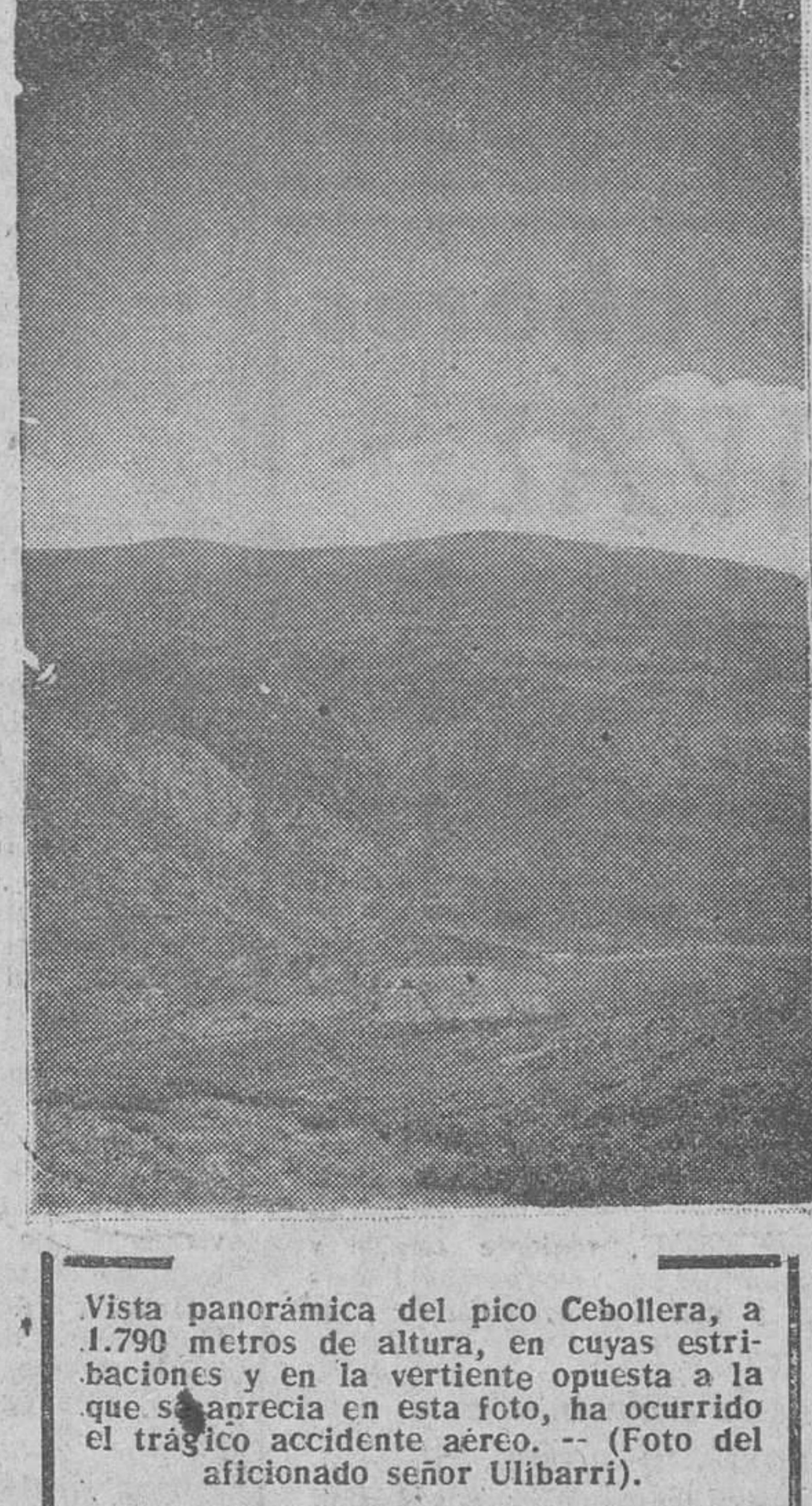
Vista panorámica del pico Cebollera, a 1.790 metros de altura, en cuyas estribaciones y en la vertiente opuesta a la que se apareció en esta foto, ha ocurrido el trágico accidente aéreo.