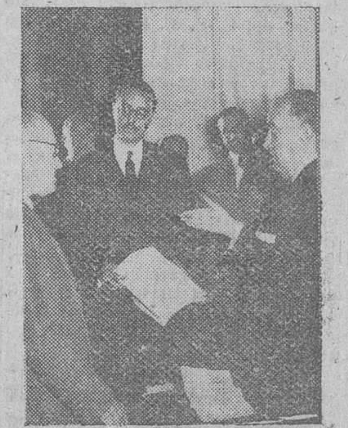
Nuestro fotógrafo en Madrid, GIL DEL ESPINAR, hizo ayer por especial encargo de DIARIO DE BURGOS, las precedentes placas de la audiencia concedida por el ministro de Obras Públicas a las autoridades burgalesas. En el grabado superior aparece el Conde de Vellellano posando para nuestro periódico en unión de todas ellas. En otro plano figura un detalle de la entrevista

Después de la entrevista con el ministro de Obras Públicas, las primeras autoridades realizaron diferentes gestiones de interés para Burgos y su provincia.