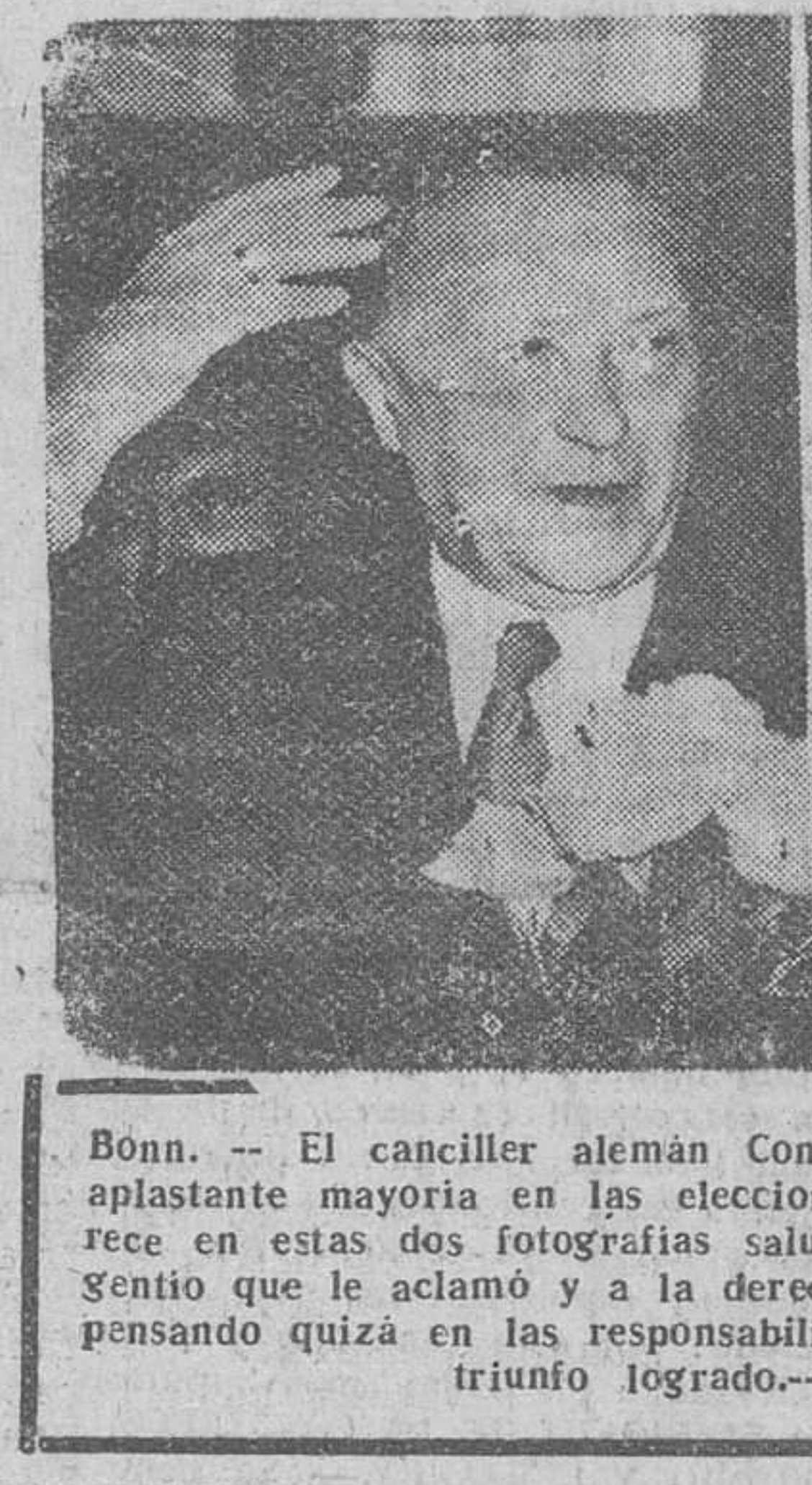
Bonn. — El canciller alemán Conrad Adenauer, tras obtener una aplastante mayoría en las elecciones celebradas el domingo, aparece en estas dos fotografías saludando sonriente a un numeroso gentío que le aclamó y a la derecha, con gesto serio y enérgico, pensando quizá en las responsabilidades que trae de la mano ese triunfo logrado.