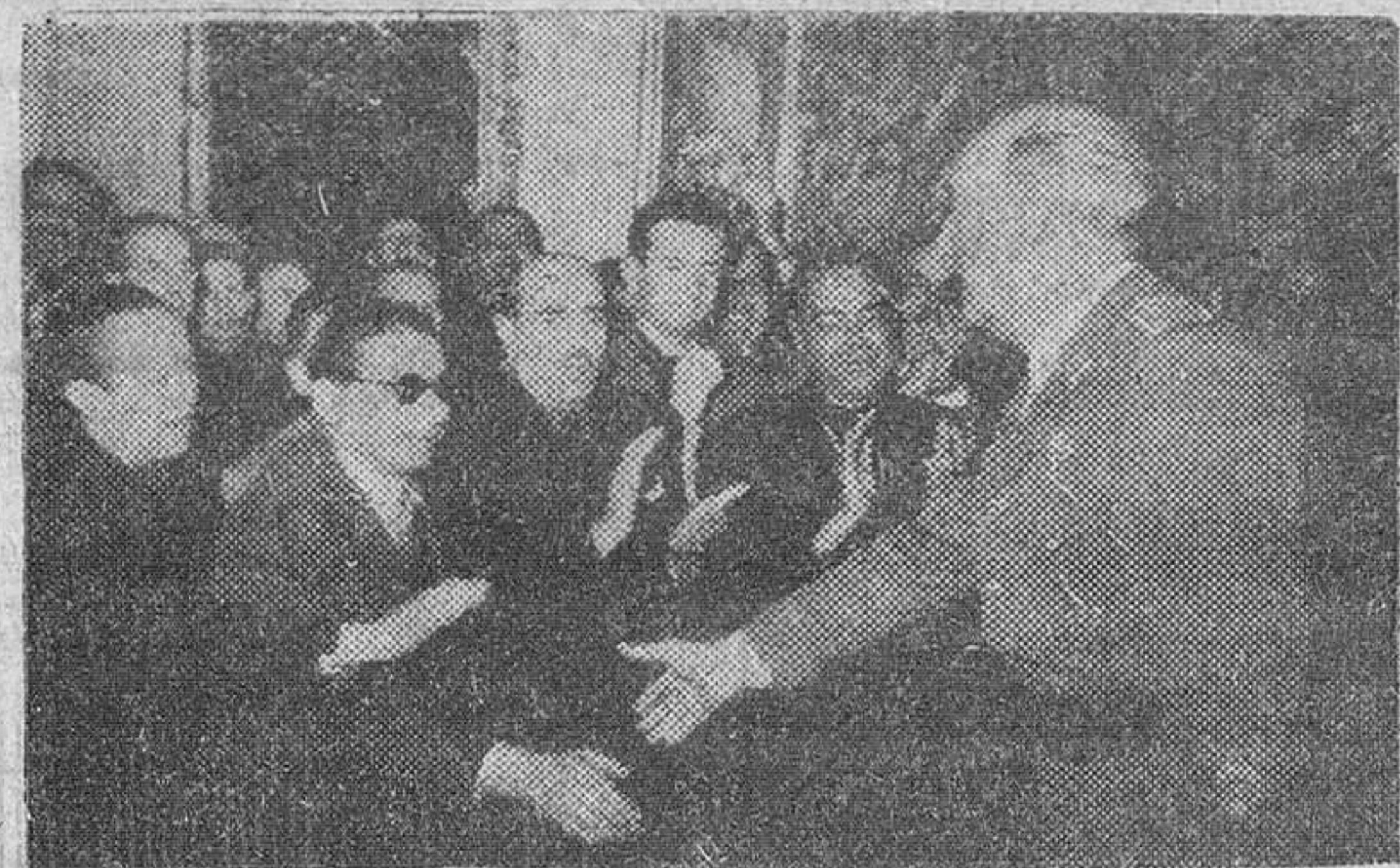
Audiencias del Caudillo Madrid.—S. E. el Jefe del Estado corresponde a las aclamaciones de los miembros del Consejo Político Sindical...