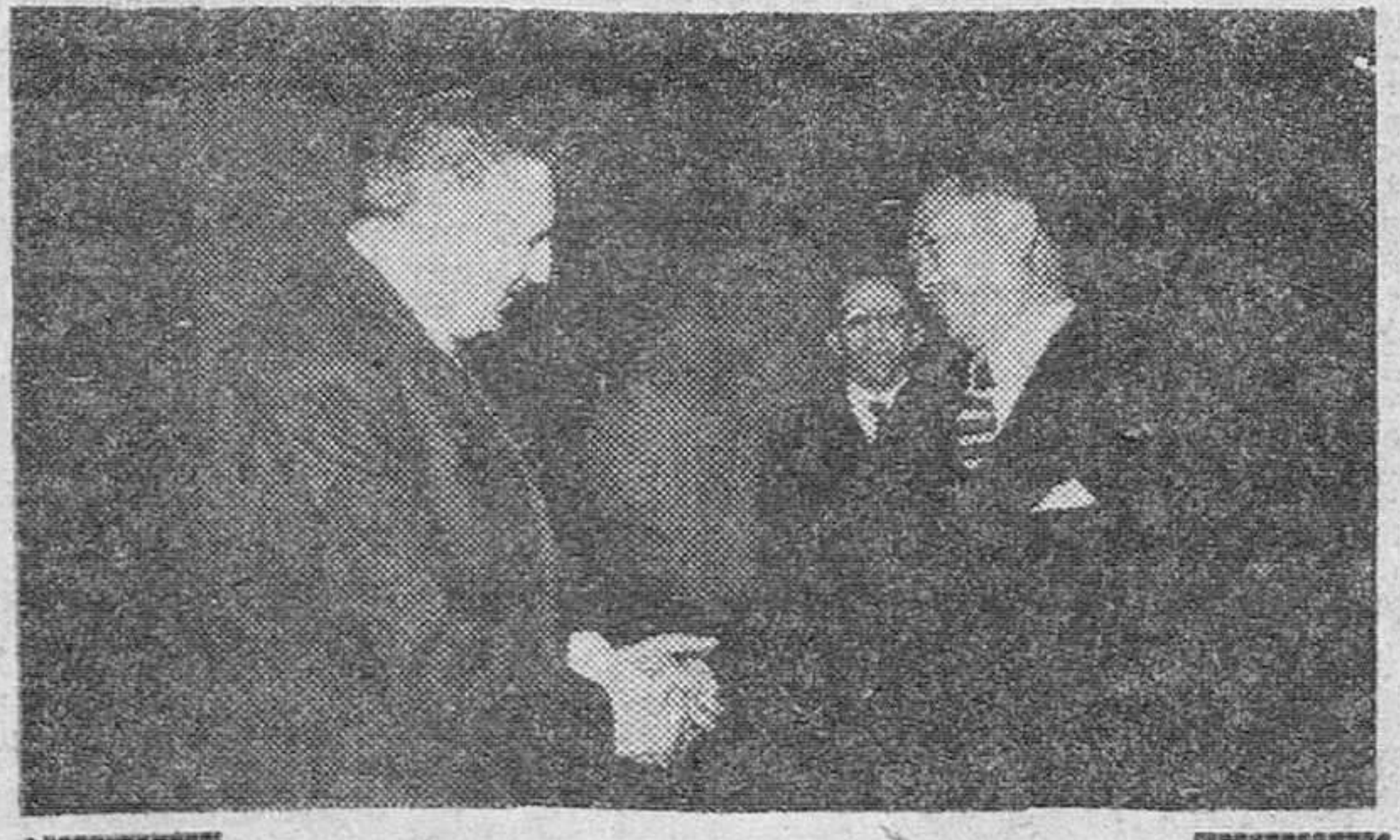
El vicepresidente filipino visita al ministro español de Asuntos Exteriores Madrid.—Don Fernando López, vicepresidente filipino, saluda al ministro de Asuntos Exteriores, señor Martín Artajo...