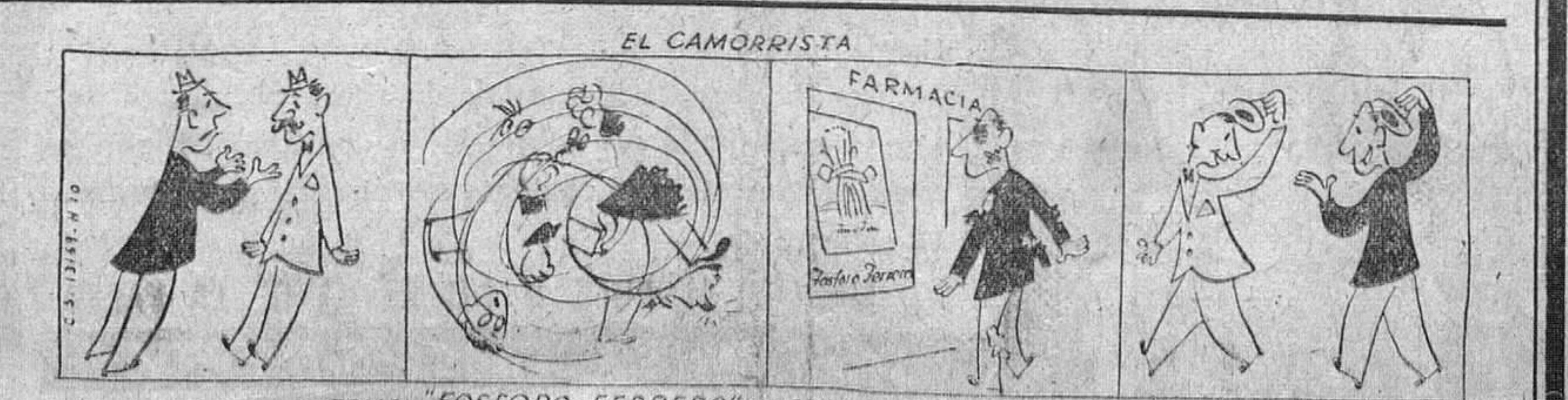
TOME 'FOSFORO FERRERO' - SERA UN HOMBRE PLACENTERO