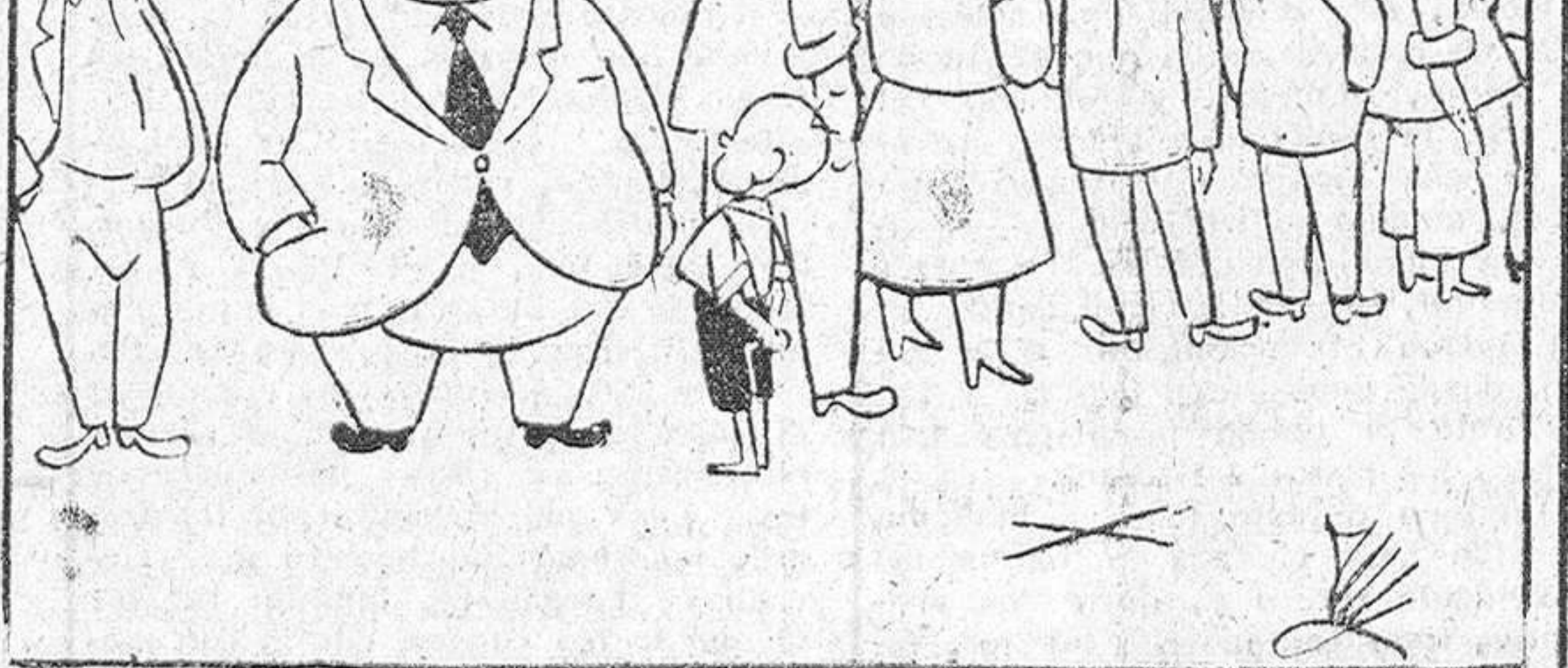
—Niño, te daré un duro si me guardas el sitio en la cola.

El Sha quiere reanudar las conversaciones petrolíferas