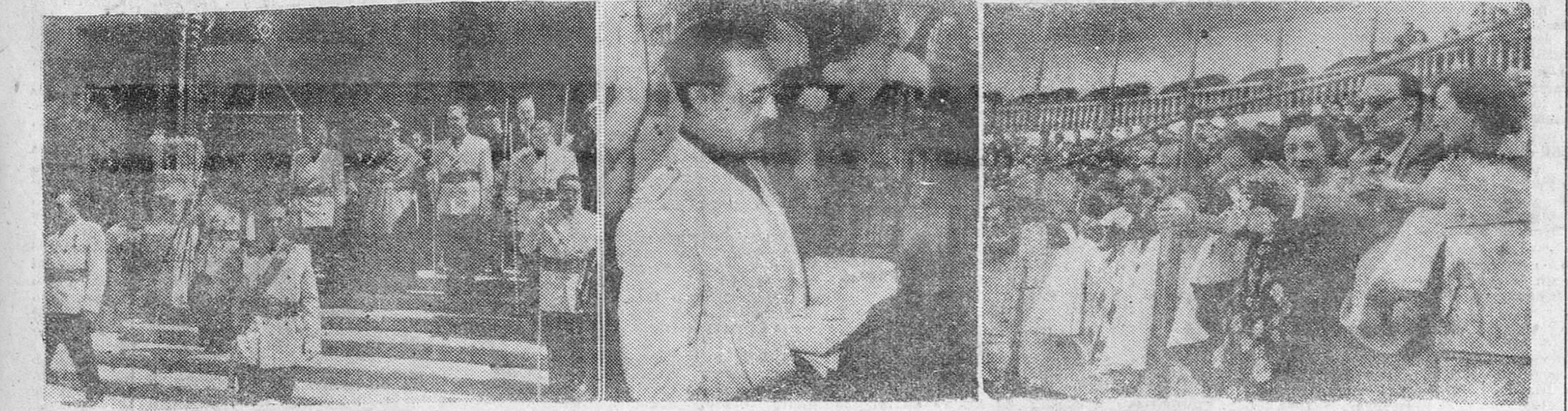
De izquierda a derecha, el Ayuntamiento, en corporación, presidido por el Rvdo. Sr. Arzobispo, a su salida de la Catedral, para dirigirse al palacio del Consistorio; el alcalde de la ciudad, leyendo la cédula de la Corporación municipal a la Patrona de la diócesis, Santa María la Mayor y por último, el gobernador civil y el alcalde, acompañados de sus respectivas esposas, presenciando la primera corrida de terias. (Fotos FEDE).