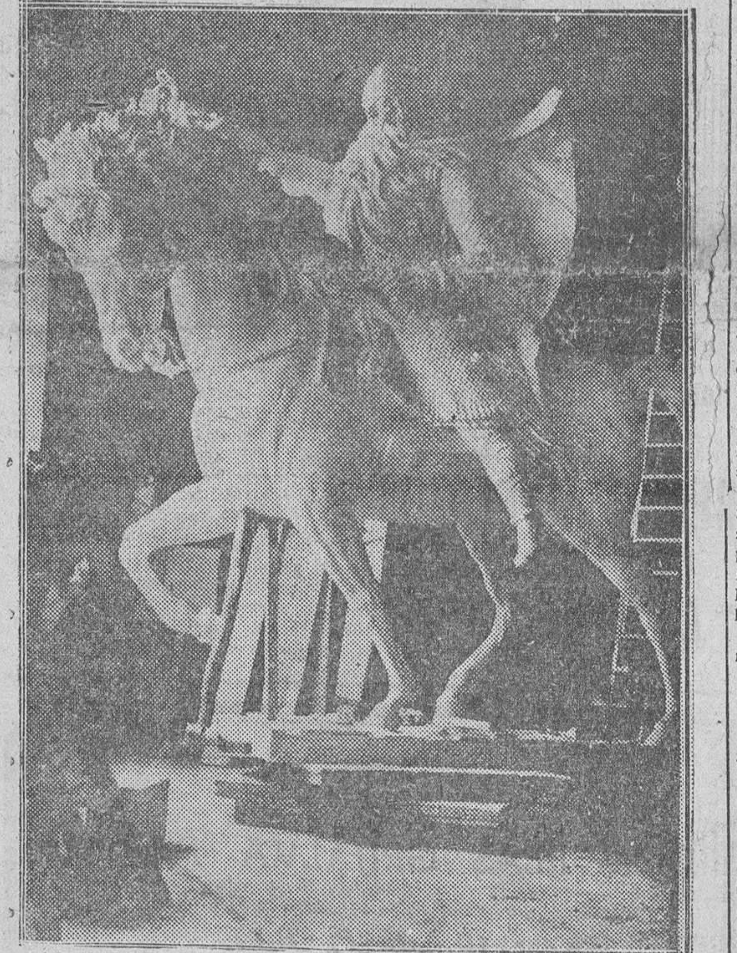
LA FOTO DE "FEDE" QUE ILUSTR A ESTA PAGINA REFLEJA LA AEROSA Y PERFECTA OBRA LOGRADA POR EL GENIAL ESCULTOR JUAN CRISTOBAL, PARA PERPETUAR EN BRONCE LA GLORIOSA FIGURA DEL CID CAMPEADOR.

Su inauguración está prevista para el año próximo