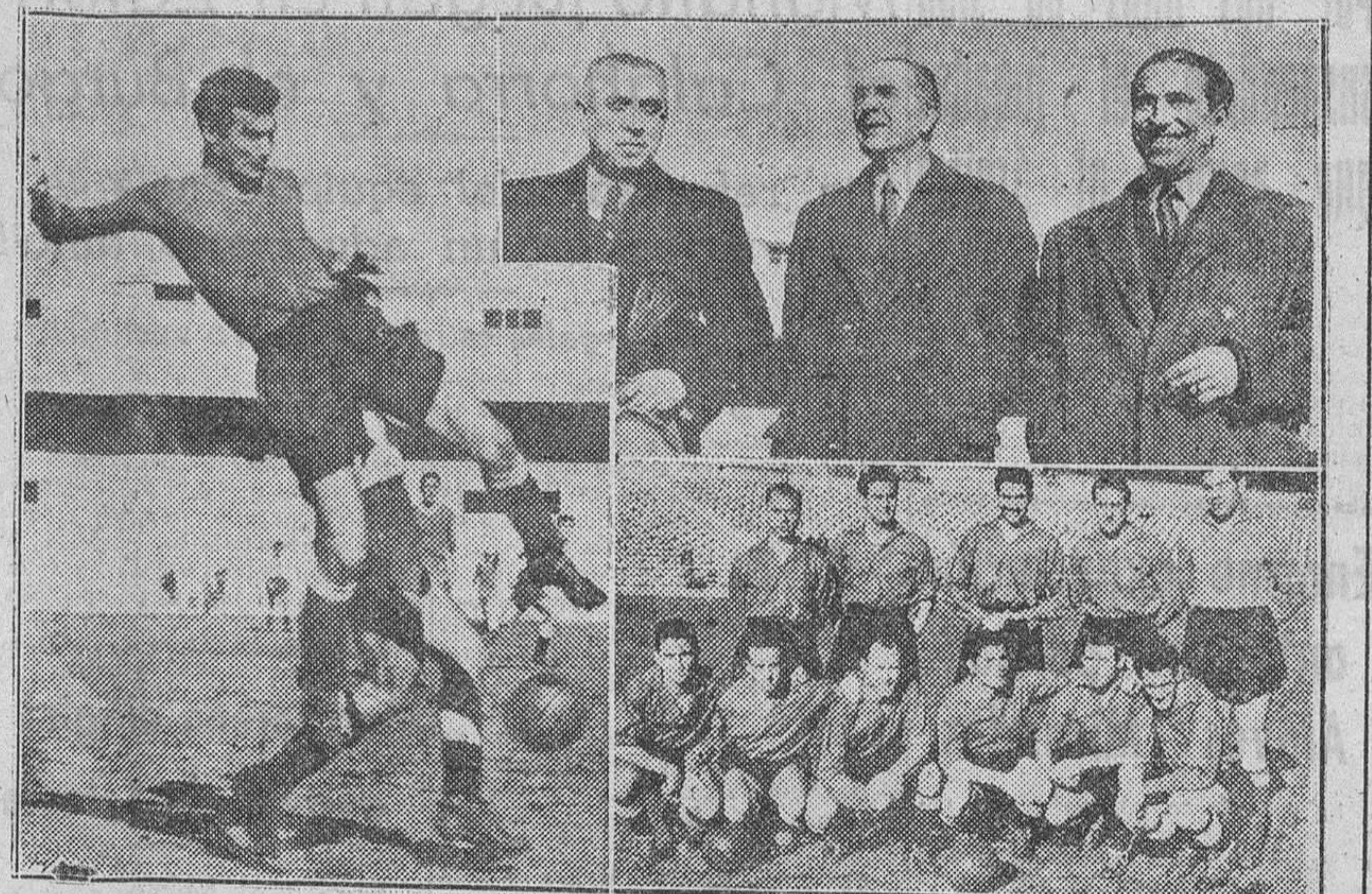
LOS PREFERENCIADOS ESPAÑOLES HAN COMENZADO A PREPARARSE ANTE EL PROXIMO ENCUENTRO INTERNACIONAL DE FUTBOL A CELEBRAR CON SUIZA EN CHAMARTIN. AQUI CRECEMOS UN REPORTAJE GRAFICO DEL PARTIDO PREPARATORIO, CELEBRADO EL JUEVES ULTIMO.

Orden aprobada en Consejo de ministros, por la que se conceden varias subvenciones para mitigar el paro obrero.