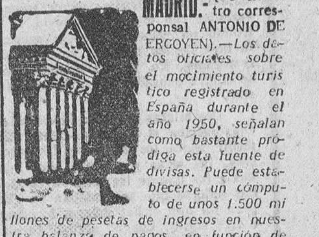
MADRID. — (De nuestro corresponsal ANTONIO DE ERGOYEN). — Los datos oficiales sobre el movimiento turístico registrado en España durante el año 1950, señalan como "bastante prodigiosa" esta fuente de divisas. Puede establecerse un cómputo de unos 1.500 millones de pesetas de ingresos en nuestra balanza de pagos, en función de las divisas cambiadas por esos turistas en pesetas durante su paso a su estancia en España. Es muy interesante conocer cuáles son las preferencias geográficas de los turistas, que ya no son las clásicas. Por orden de abundancia de turistas, las plazas receptoras se escalonan por este orden: Madrid, Barcelona, San Sebastián, Palma de Mallorca, Sevilla, Granada y Canarias. Esta clasificación prueba bien claramente que el turista de hoy no es como el turista de antaño, que buscaba rodearse con los monumentos históricos que encierran nuestras viejas ciudades, aunque hay que reconocer que muchos de estos viajeros han hecho oportunas escalas y excursiones a aquellos lugares tan de primera fila como Toledo, Burgos, Salamanca, Avila, Santiago de Compostela y tantos otros.

— ¿Qué tal se presenta este año para el turismo? — Las autoridades del turismo consideran que si la psicosis de guerra no se agrava, este año puede mejorar todavía al anterior en cuanto a la afluencia de turistas en España, considerando que el mejor propagandista de nuestro país entre los extranjeros es cada uno de nuestros visitantes.