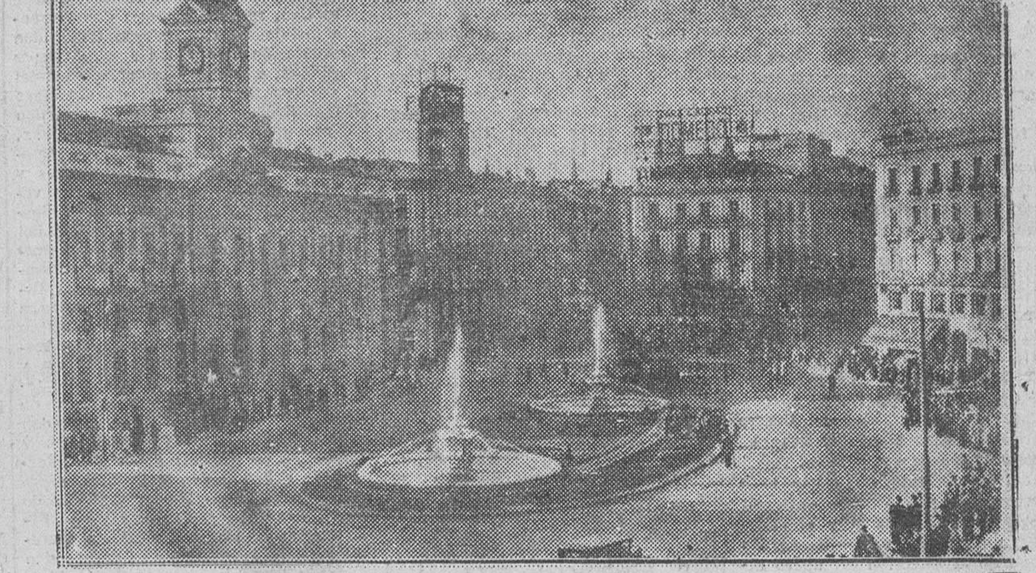
UNA VISTA DE LA PUERTA DEL SOL, DESPUES DE SER INAUGURADAS LAS FUENTES CONSTRUIDAS EN MEDIO DE LA POPULAR PLAZA MADRILEÑA.