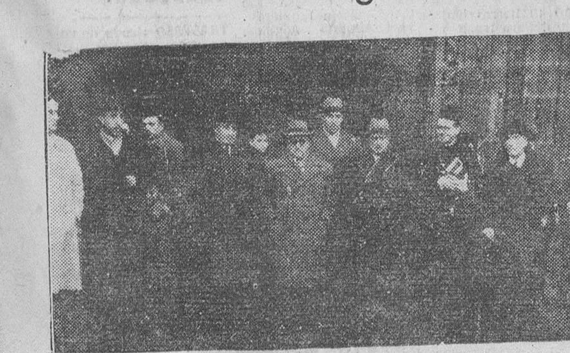
PERSONALIDADES QUE PRESIDIERON LA MISA CELEBRADA EL PASADO DOMINGO EN LA IGLESIA DE LA MERCED POR LAS CAJAS DE AHORROS BENEFICAS CON MOTIVO DE LA FIESTA DE LA SAGRADA FAMILIA, PATRONA DE DICHAS INSTITUCIONES, FOTOGRAFIADAS A LA SALIDA DE DICHO TEMPLO.