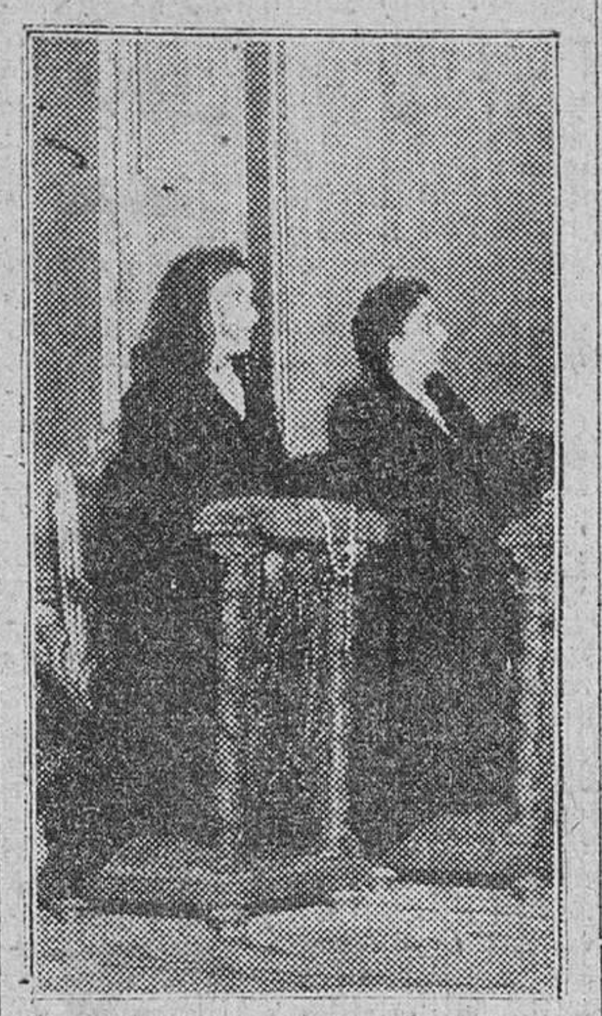
Madrid.—La esposa del Caudillo y su hija durante los solemnes funerales por el alma del General Primo de Rivera, celebrado en la iglesia de San José, y al que también asistieron varios miembros del Gobierno.