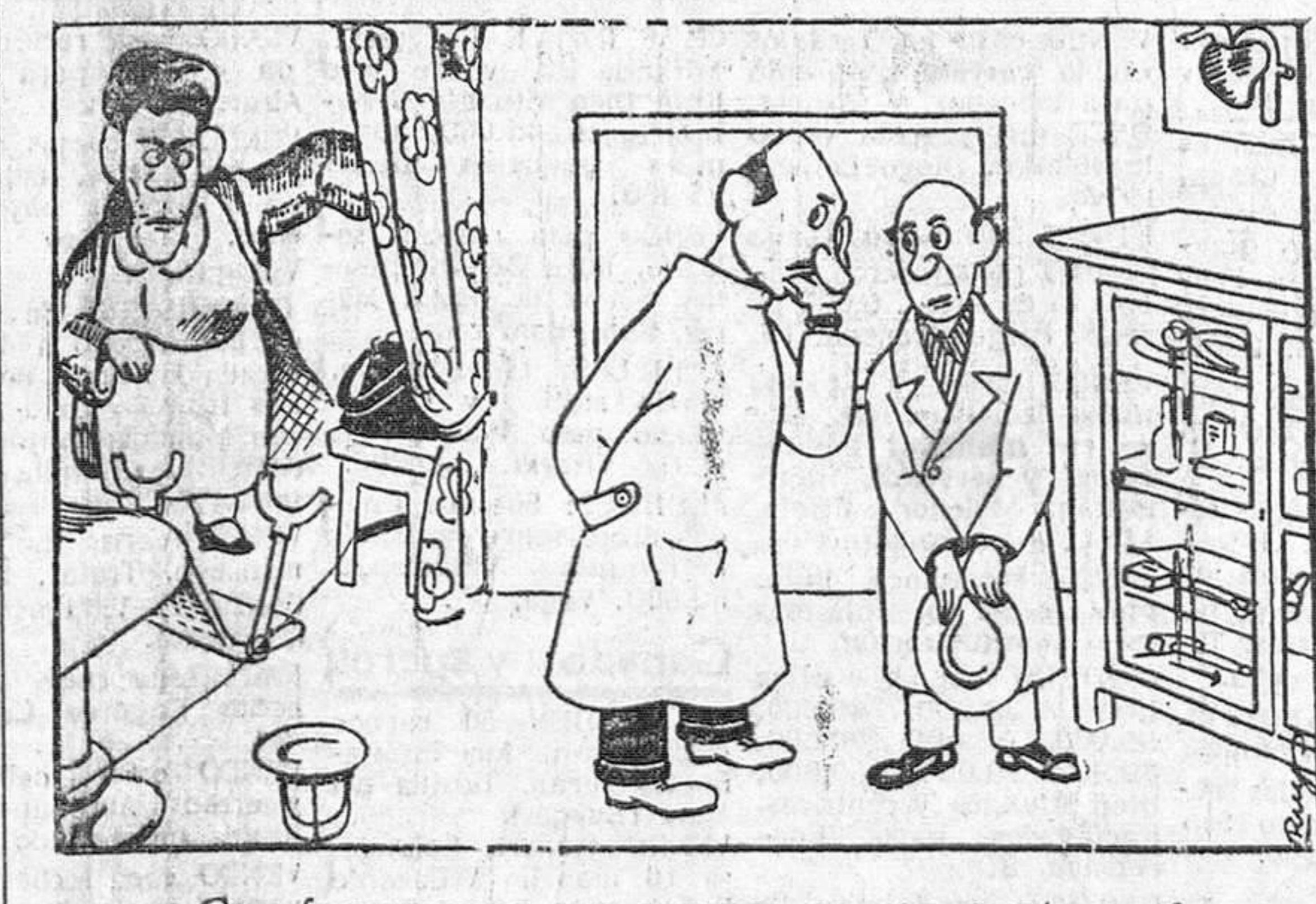
—Con franqueza, su esposa no me gusta nada —Pues, confianza por confianza, doctor; ¡a mí tampoco!