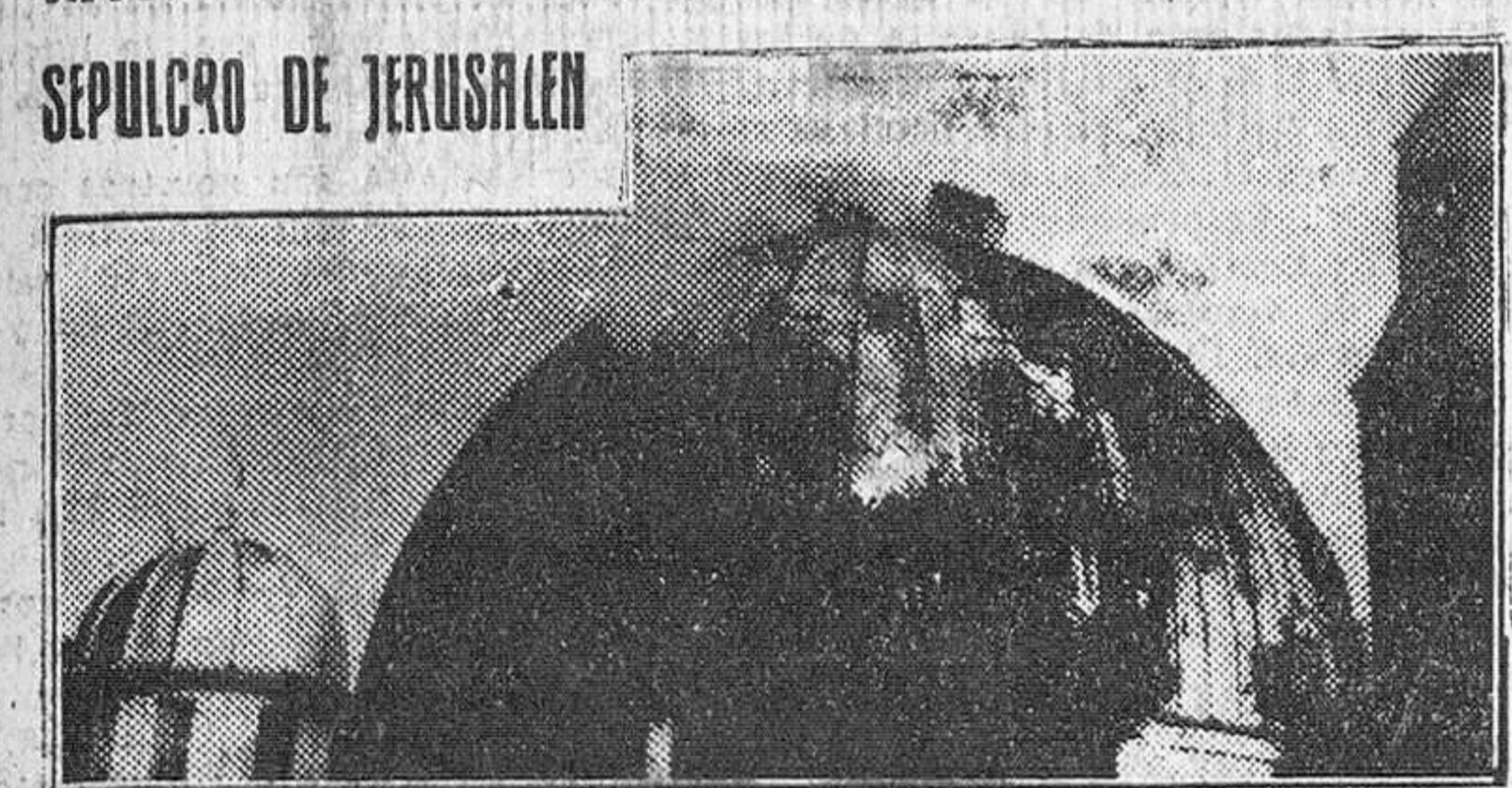
Jerusalén.—Aspecto de la cúpula central de la Basilica del Santo Sepulcro al iniciarse el siniestro de que ha sido objeto.