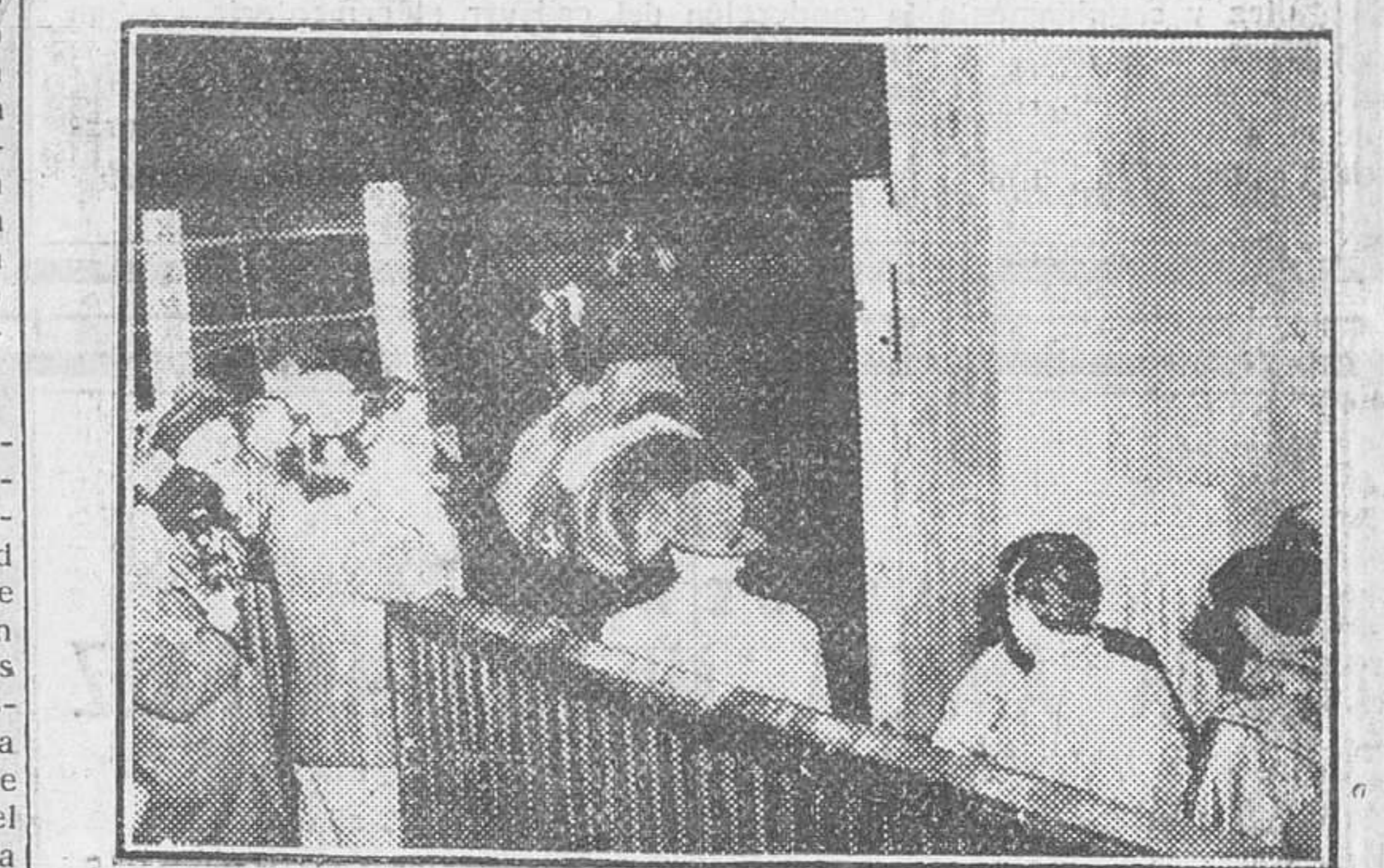
PARIS. — La rejoneadora Conchita Cintrón que actuó junto con Angel Luis Bienvenida y "Vito", sale al ruedo improvisado en el Velódromo de Invierno de la capital francesa para rejonear a uno de sus toros.