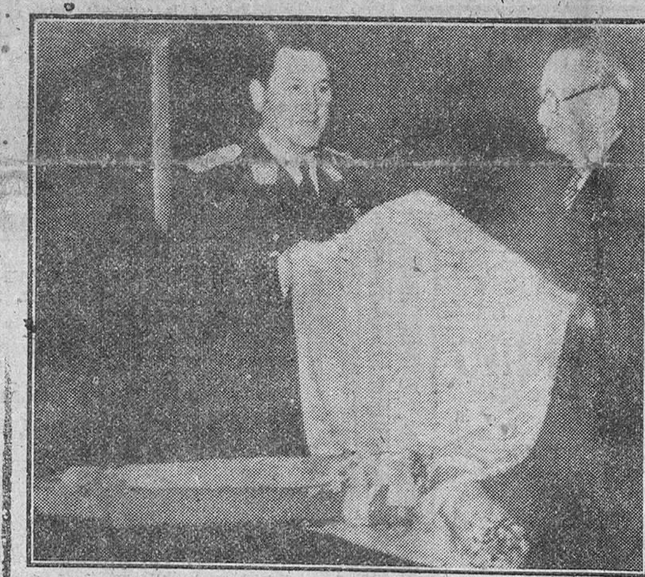
Buenos Aires.—El general Perón recibe de manos del Presidente de las Cámaras de Comercio Argentina las piezas de tejido de arriesaña con que le obsequian los obreros de la Fábrica de Tejidos de don José Tous, de Pont de Armentera (Tarragona). El presidente correspondió dedicándole una foto en la que aparece vistiendo "mono".