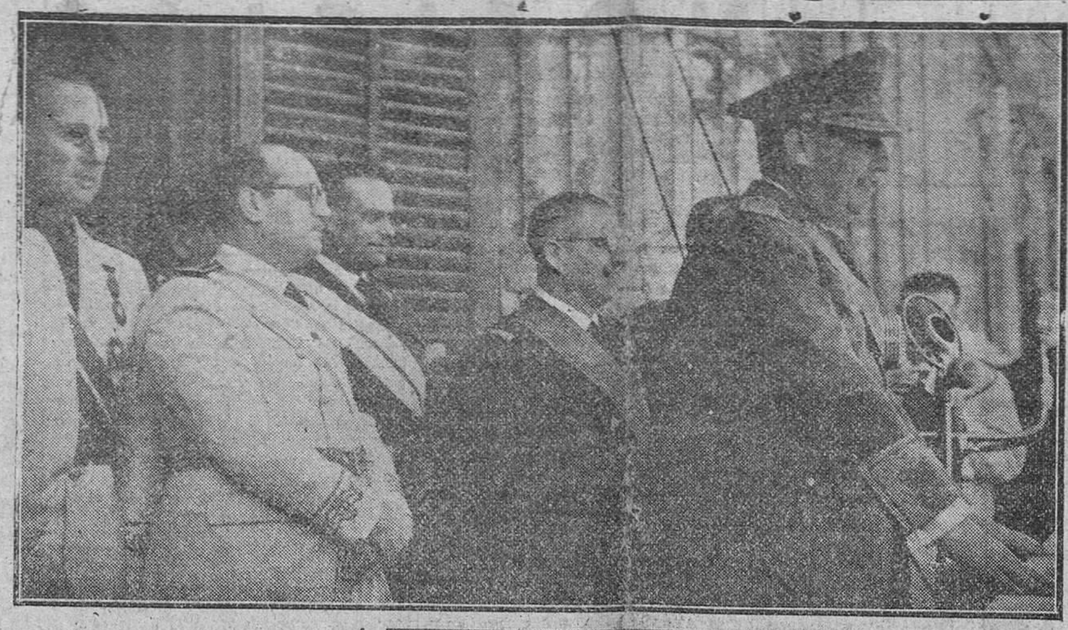
Presentamos un reportaje gráfico de la patriótica jornada del "Día de la Victoria" en Madrid. A la izquierda, el Caudillo presenciando el desfile de las tropas. A la derecha S. E. correspondiendo a las aclamaciones de la multitud, desde el palacio de Oriente. Al pie, la muchedumbre congregada en dicha plaza, aclama al jefe del Estado.