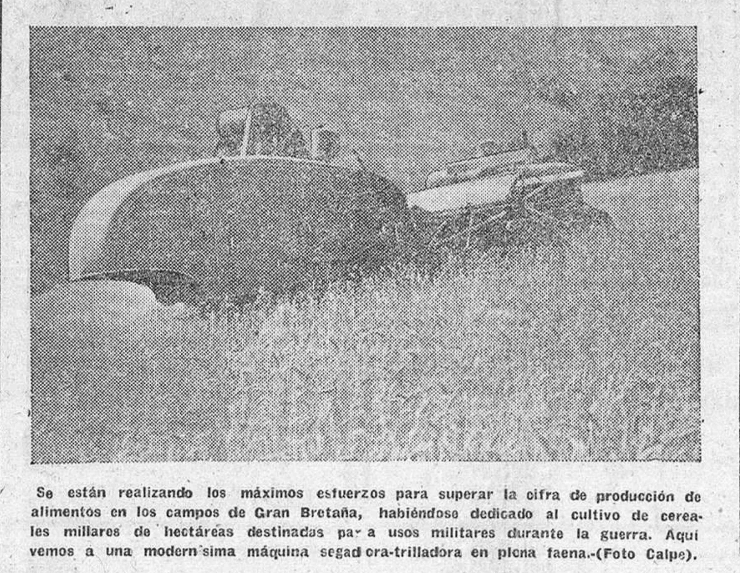
Se están realizando los máximos esfuerzos para superar la cifra de producción de alimentos en los campos de Gran Bretaña, habiéndose dedicado al cultivo de cereales militares de hectáreas destinadas para usos militares durante la guerra. Aquí vemos a una modernísima máquina segadora-trilladora en plena faena.