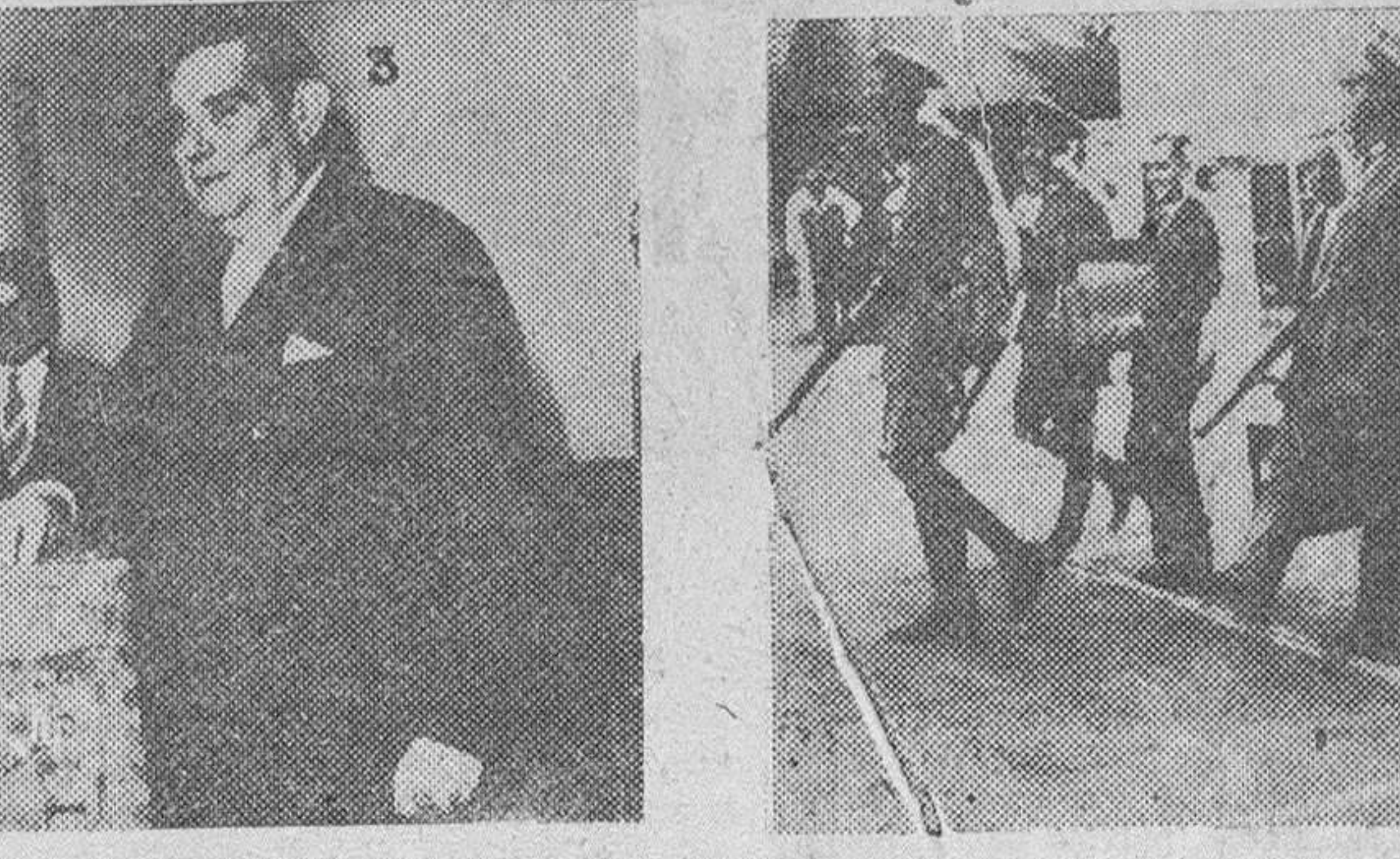
Custodiadas por las tropas del ejército argentino, son llevadas las urnas que contienen las papeletas de los votantes, para el recuento de votos, después de cerrarse la jornada electoral