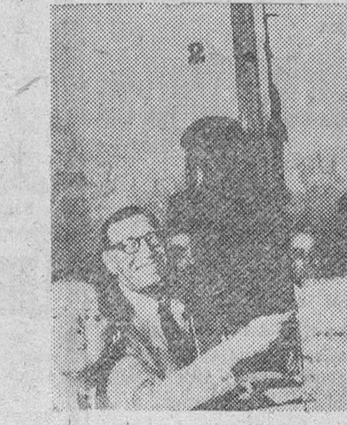
El doctor Tamborini, candidato a la Presidencia de la República Argentina por la Unión Democática, emite su voto en el correspondiente distrito de Buenos Aires