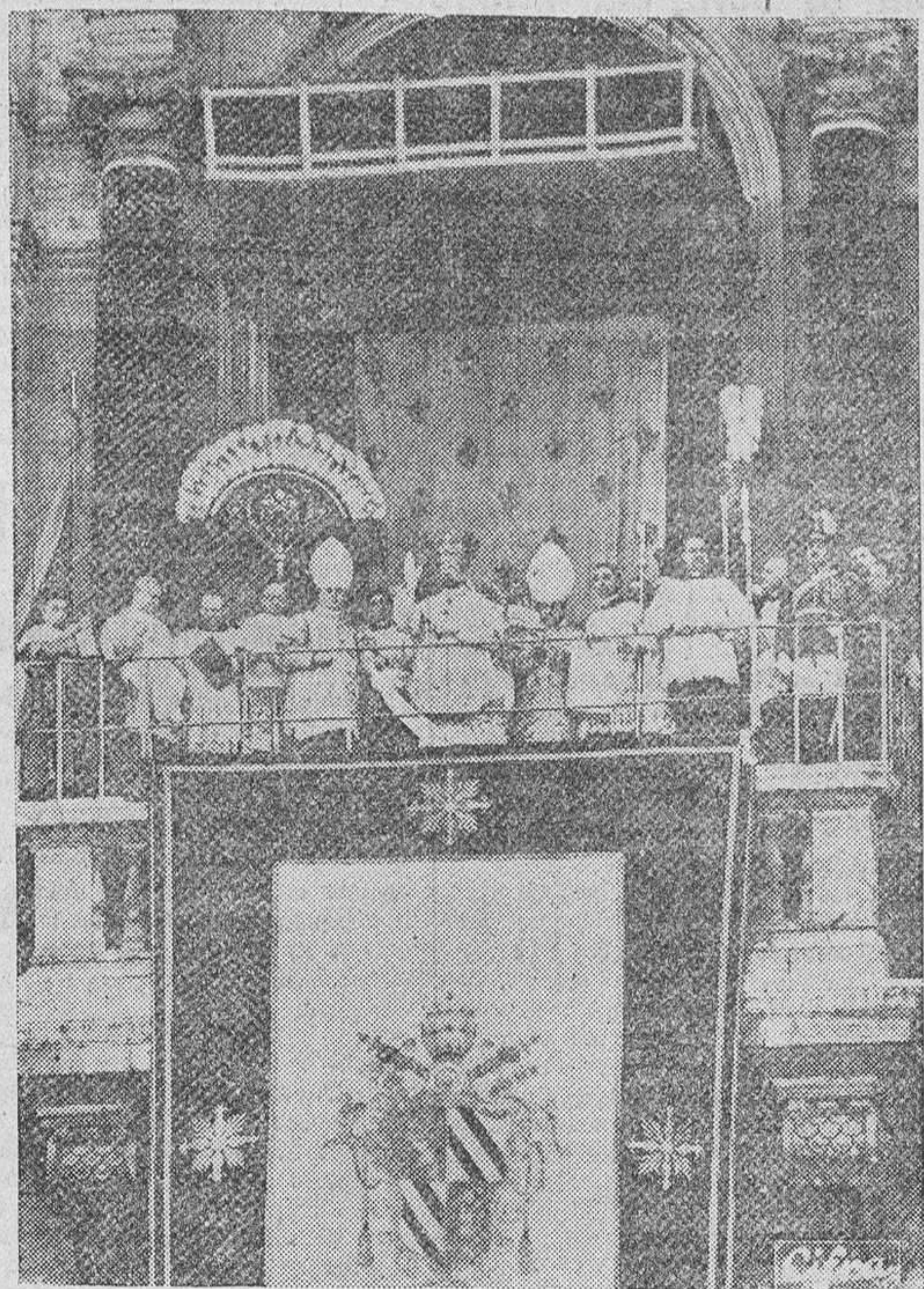
S. S. Pío XII, dando la bendición "urbi et orbi", el día de su consagración

sonalísima del Patriarca. Su voz timbrada que resonaba en todos los actos con tono solemne.