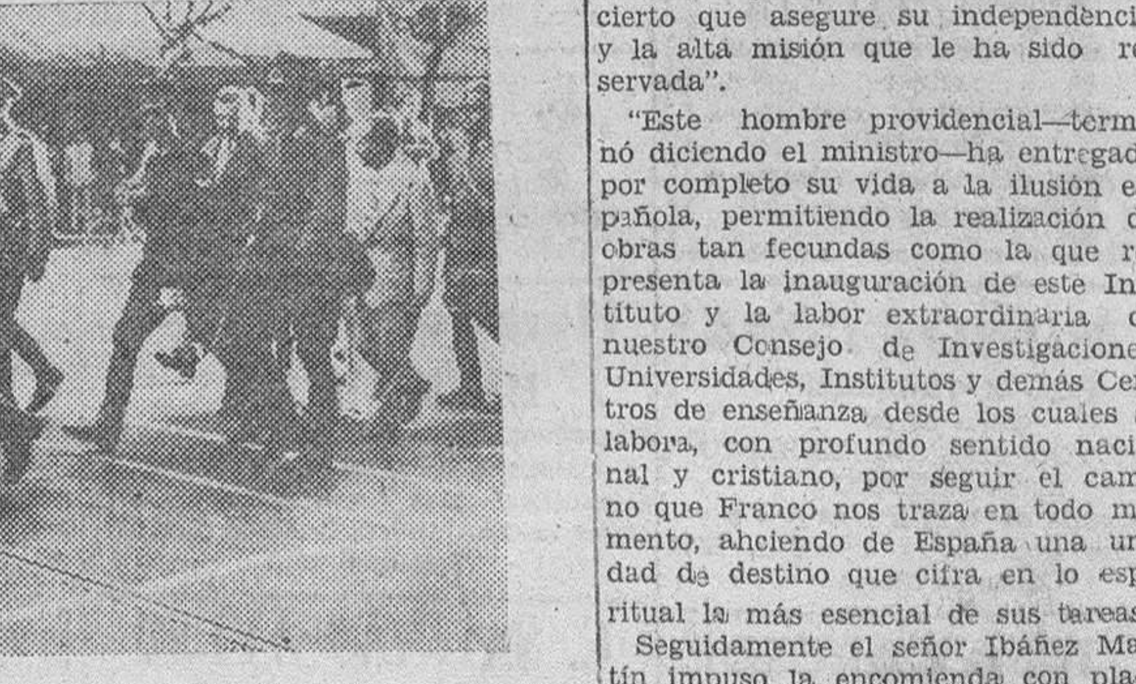
Custodiadas por las tropas del ejército argentino, son llevadas las urnas que contienen las papeletas de los votantes, para el recuento de votos, después de cerrarse la jornada electoral