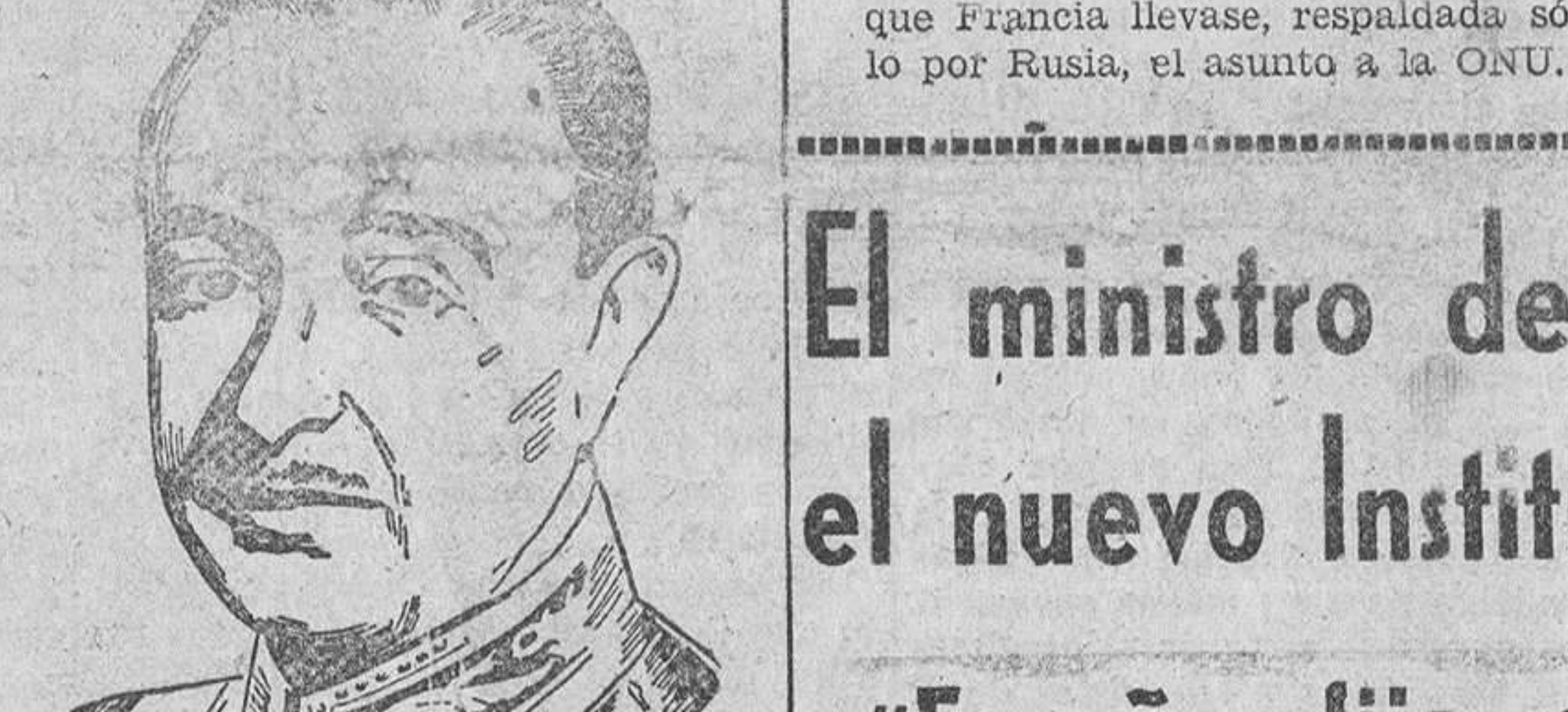
D. José Félix de Lequerica en Burgos