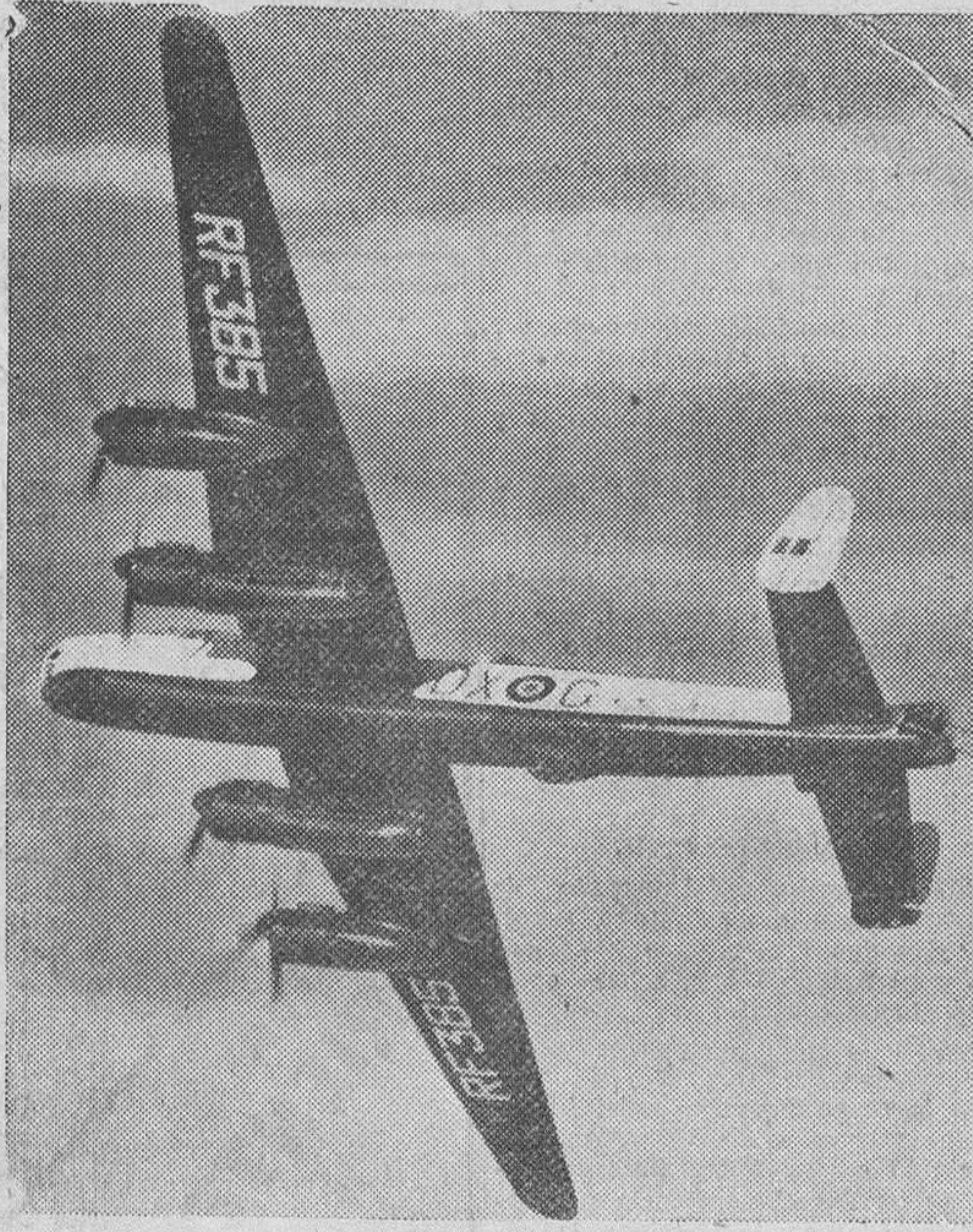
HE AQUÍ LA PRIMERA FOTOGRAFIA HECHA PUBLICA DEL MAYOR Y MEJOR APARATO DE BOMBARDEO QUE POSEE LA R. A. F. EN LA ACTUALIDAD: EL "LINCOLN" BA EQUIPADO CON "RADAR" Y LLEVA DIEZ AMETRALLADORAS DISTRIBUIDAS EN LAS DOS TORRETTAS DEL AVION.