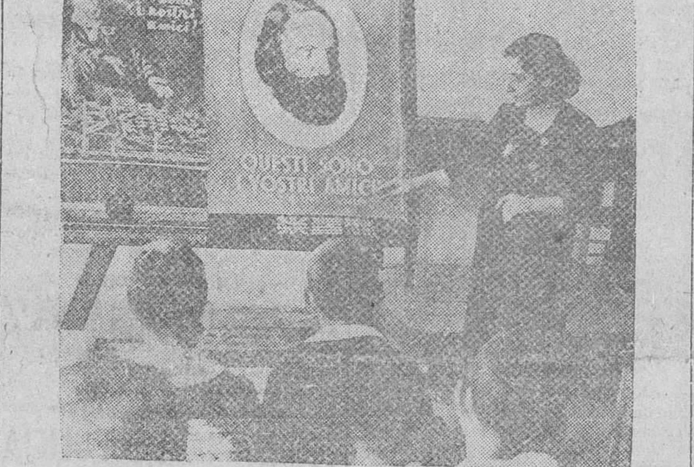
Los niños de una escuela de una ciudad italiana, contemplan el retrato de Giuseppe Garibaldi...