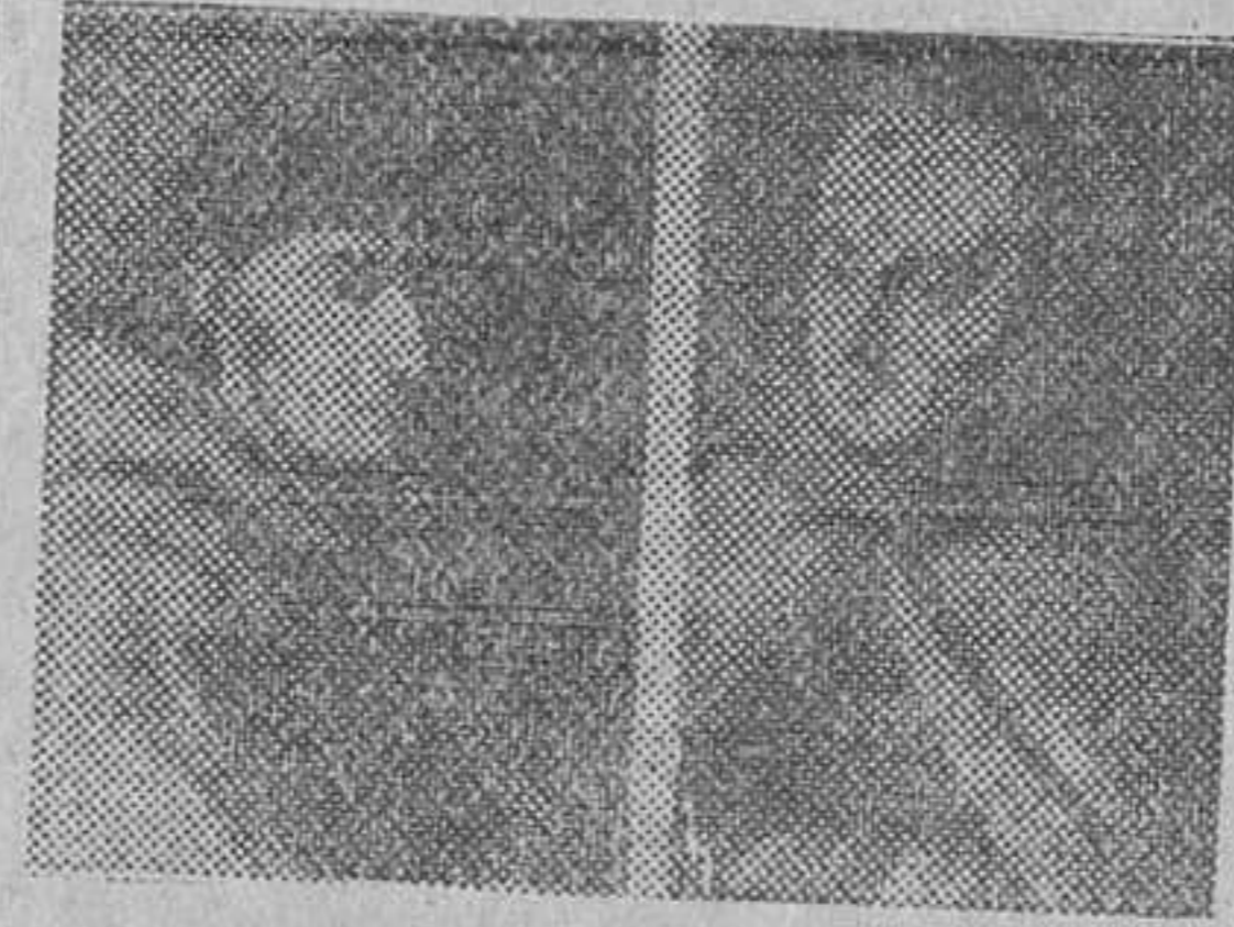
Fray Bernardino de Sahagún, uno de los más famosos historiadores de las costumbres y tradiciones indígenas...