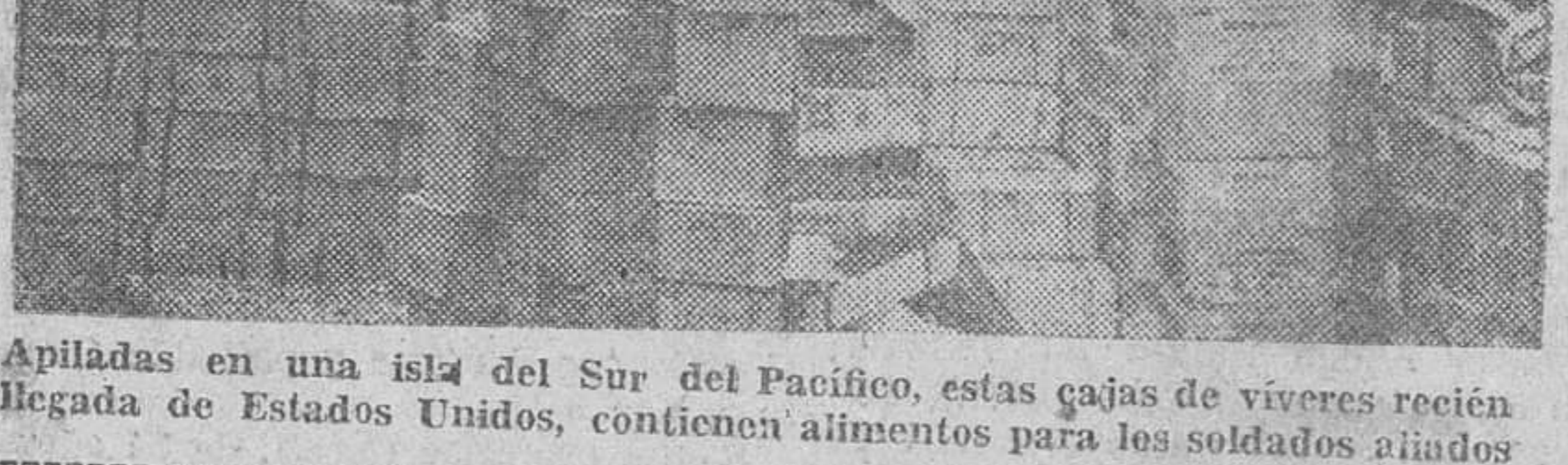
Viveres para los soldados norteamericanos en el Pacifico