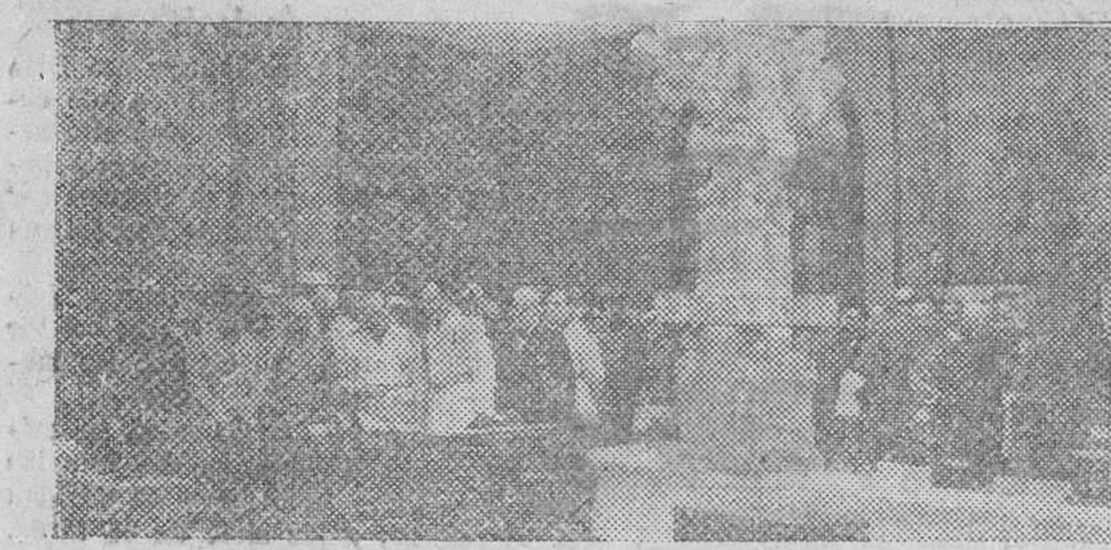
El Caudillo visitando la Exposición Nacional de las Escuelas de Artes y Oficios de España se detiene ante algunas elaboraciones artesanas de mariposaria y forja en la sala que preside el magnífico crucep en mármol de la Escuela de Patencia.