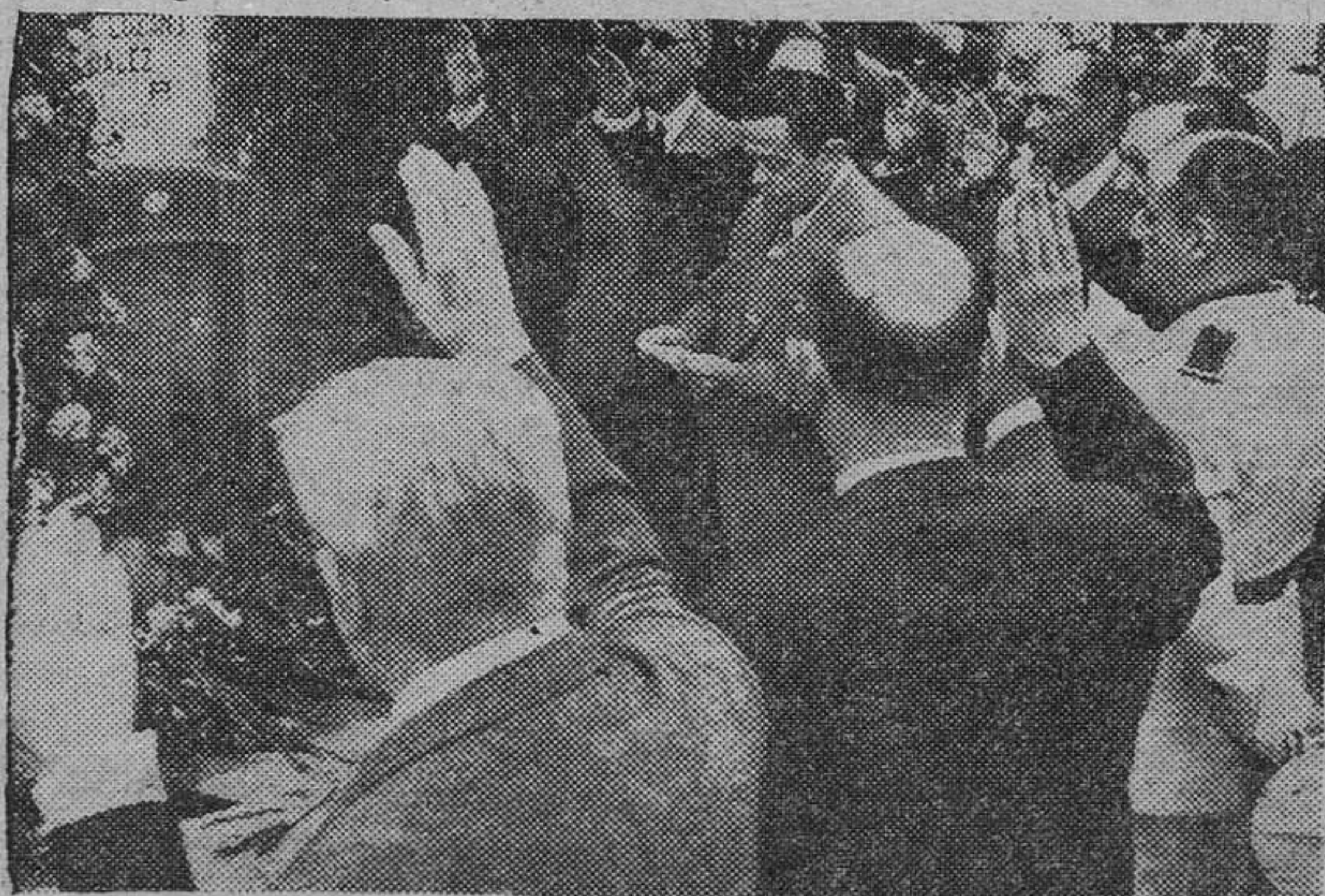
En Madrid se ha celebrado el día del periodista caído. He aquí la presidencia del acto