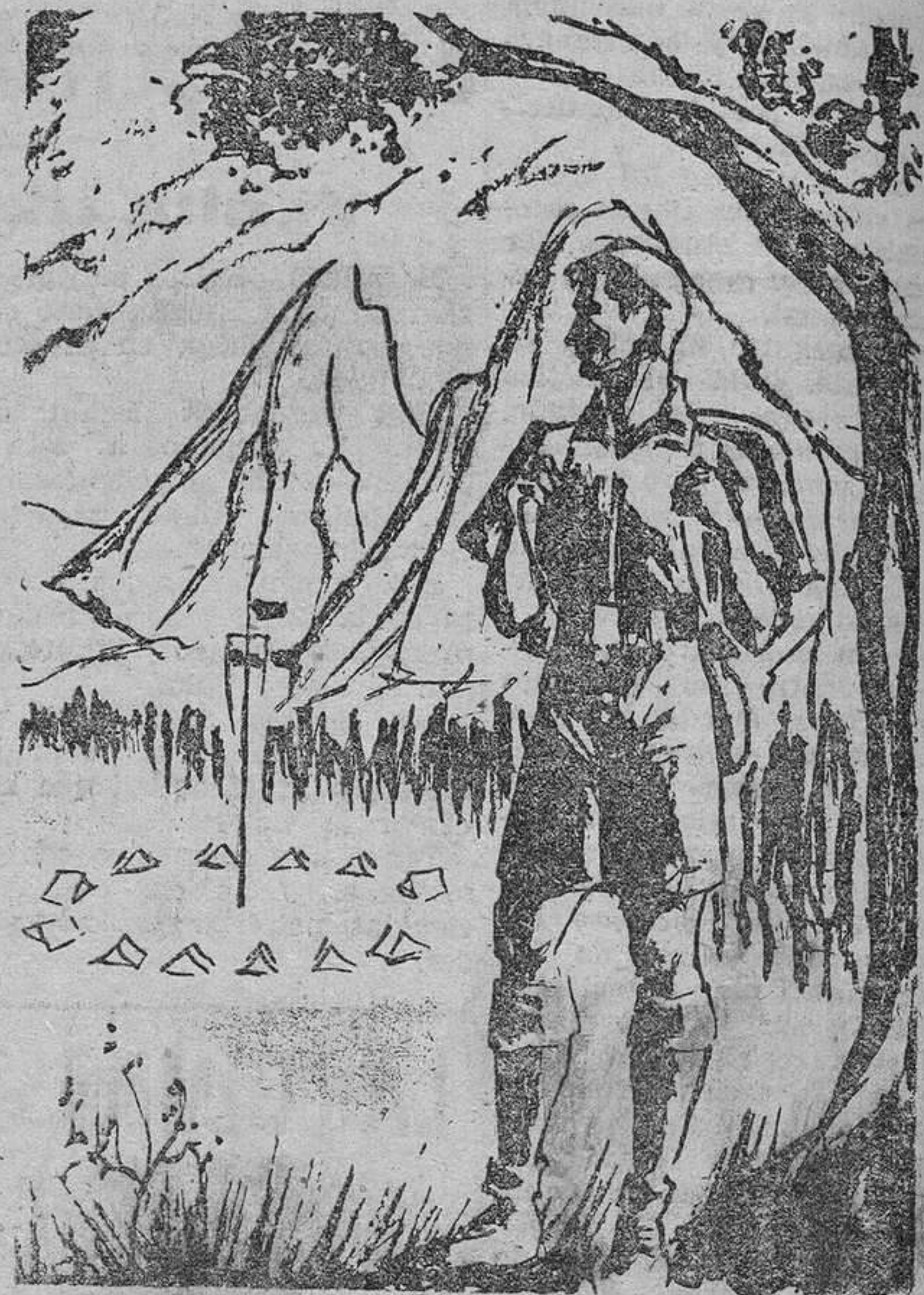
«Nuestra España se encuentra por los riscos y los vericuetos» JOSE ANTONIO