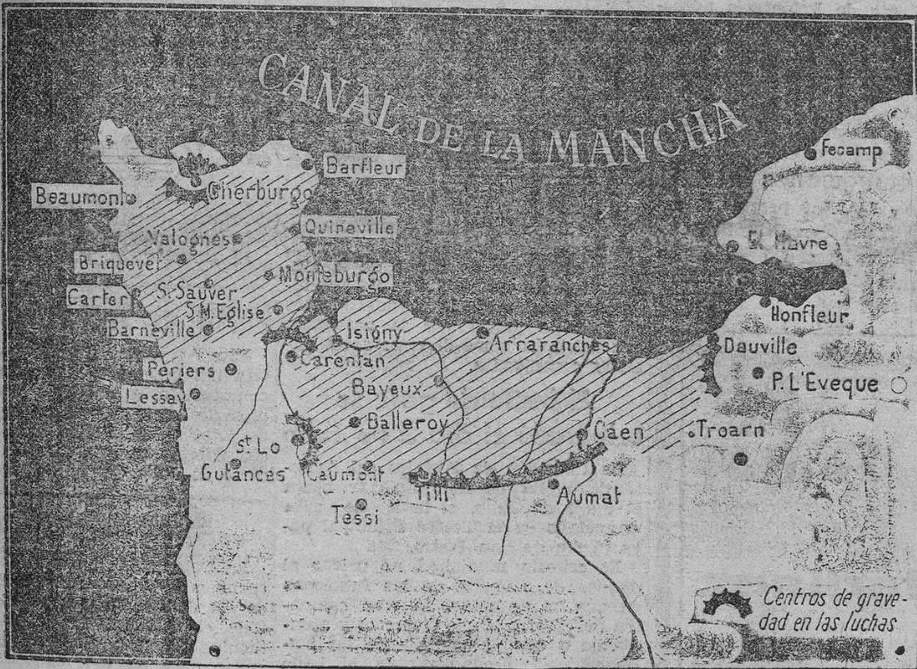
He aquí, señalada en el gráfico, la actual situación del frente de la invasión, después de los combates que se han desarrollado en la última semana