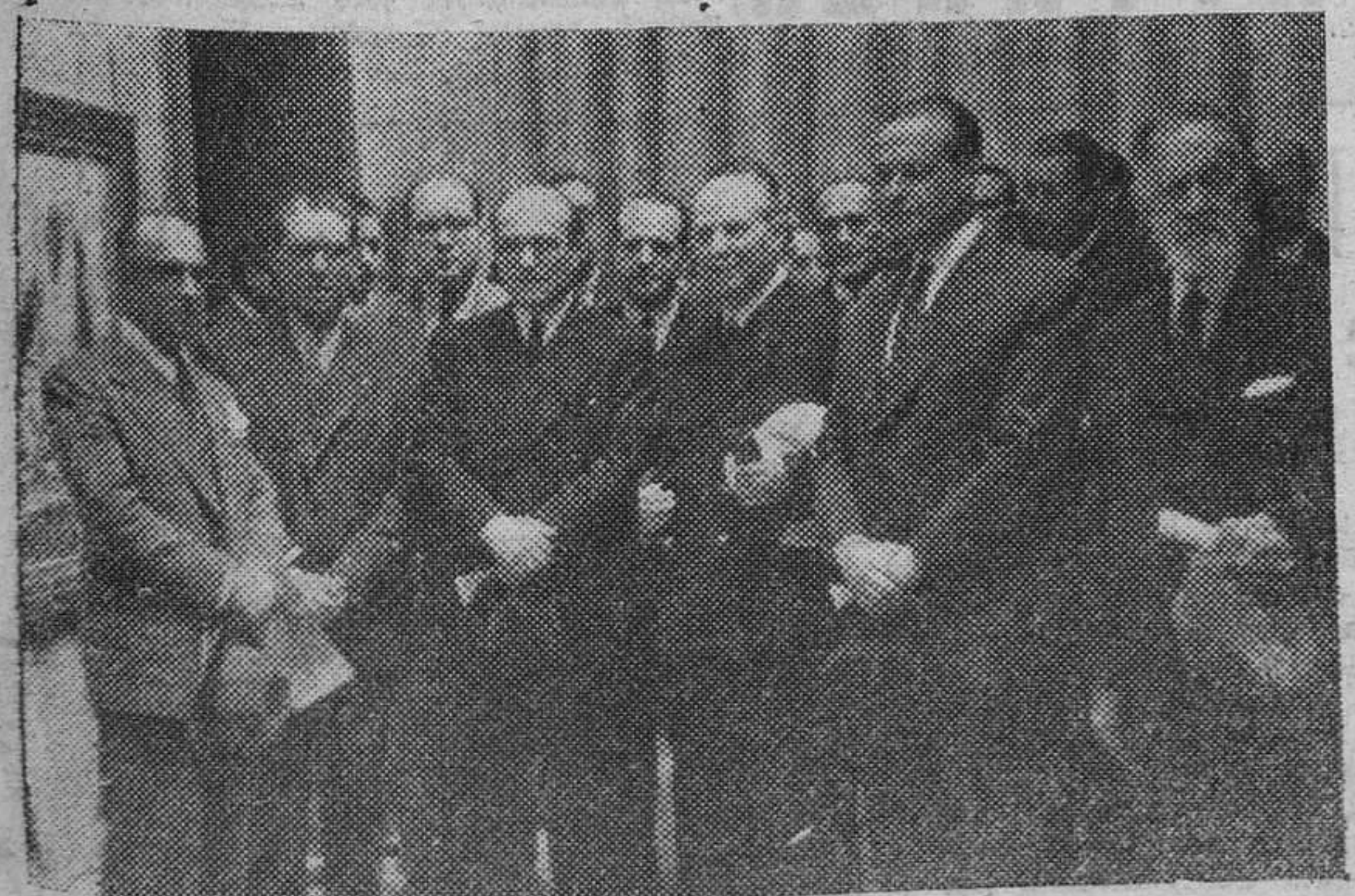
Madrid.—Los ministros de la Gobernación y Educación Nacional y otras autoridades y jerarquías visitan la Exposición de Artistas de la provincia de Gran Canaria.