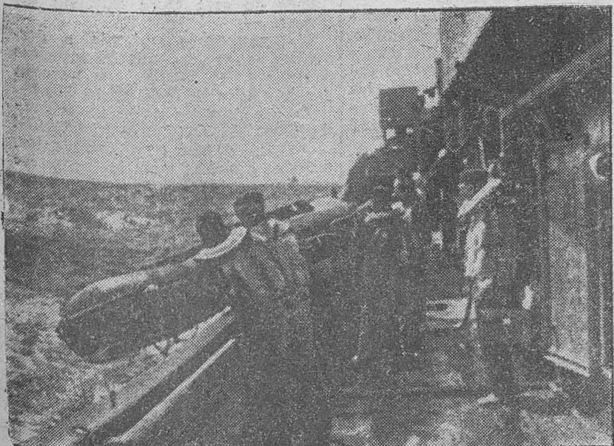
En un patrullero alemán, un tripulante ha resultado herido en acción de guerra. Rápidamente se arria un bote para ir en busca de auxilio médico en otro patrullero próximo

3.251 millones ha invertido España en la creación de nuevas industrias