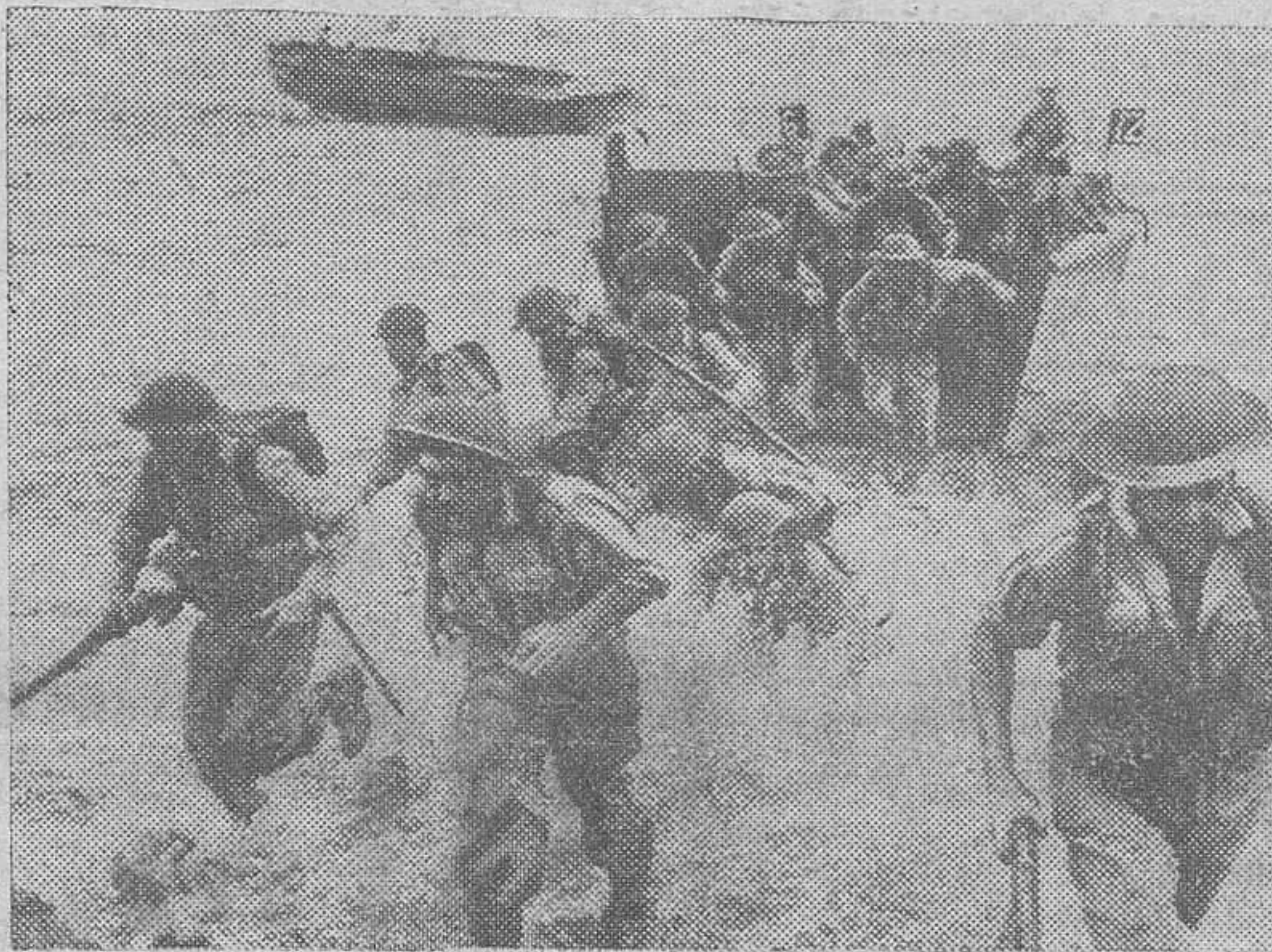
Soldados neozelandeses haciendo prácticas de desembarco en una isla del Pacífico