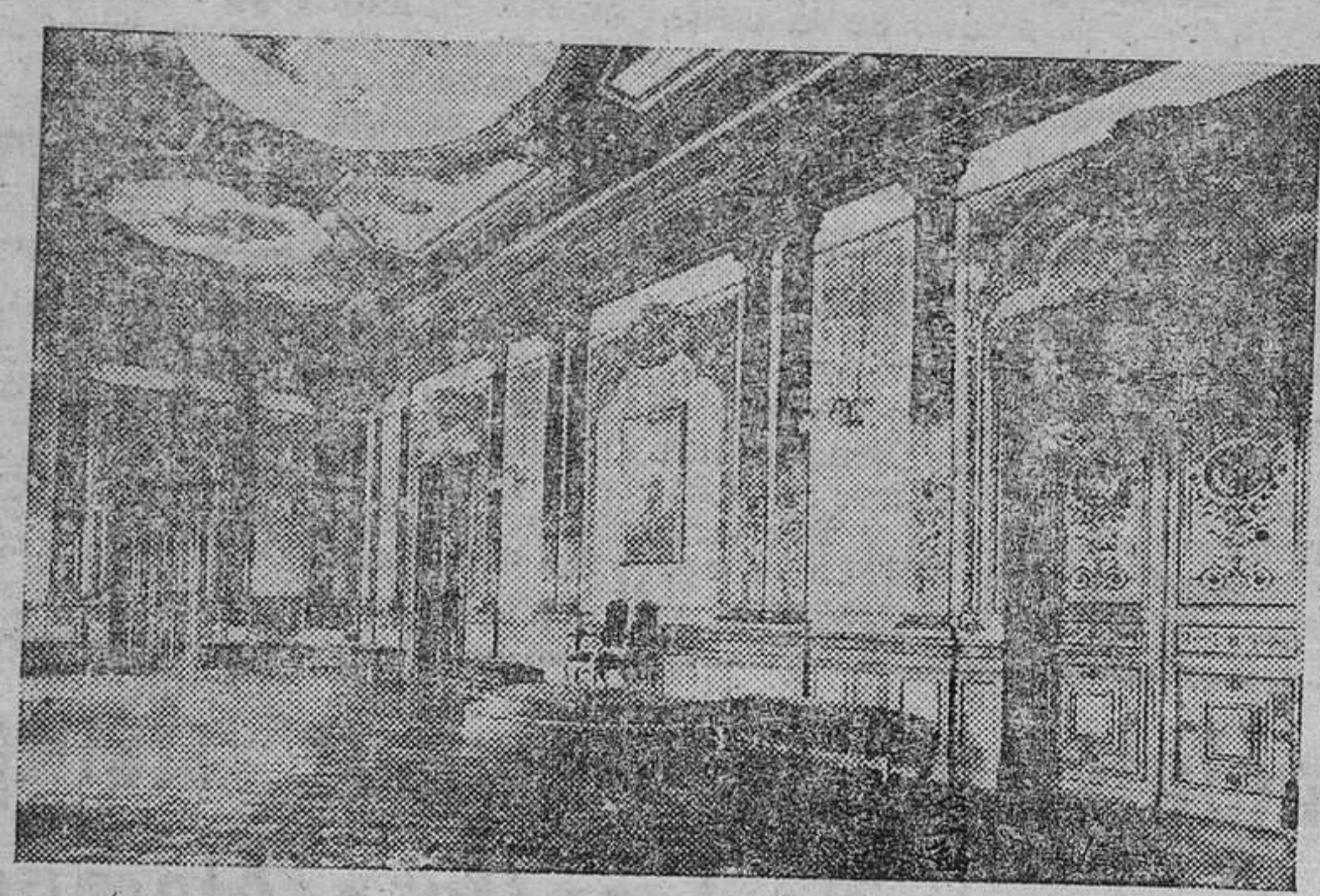
El histórico salón del trono del Palacio de Capitania, en Burgos, donde Franco fué ungido Caudillo de España por la Junta de Defensa Nacional, el 1.º de Octubre de 1936 (Foto Suso).

sorpreza para muchos el que Burgos viera a surgir como "caput" de un Movimiento nacional dispuesto a barrer de nuestro suelo un estado de cosas que por antiespañol y antecristiano nos llevaba a la muerte. Formó la ciudad a su misión de caudillaje y frente a Madrid entonces —sede de la potencia "roja"— alzó su bandera que es la de 1808 años; con gallardía y con fé. Y en el mismo año de 1936 manifestó Burgos su predestinación. Y en que circunstancias tan arduas y transcendentales!