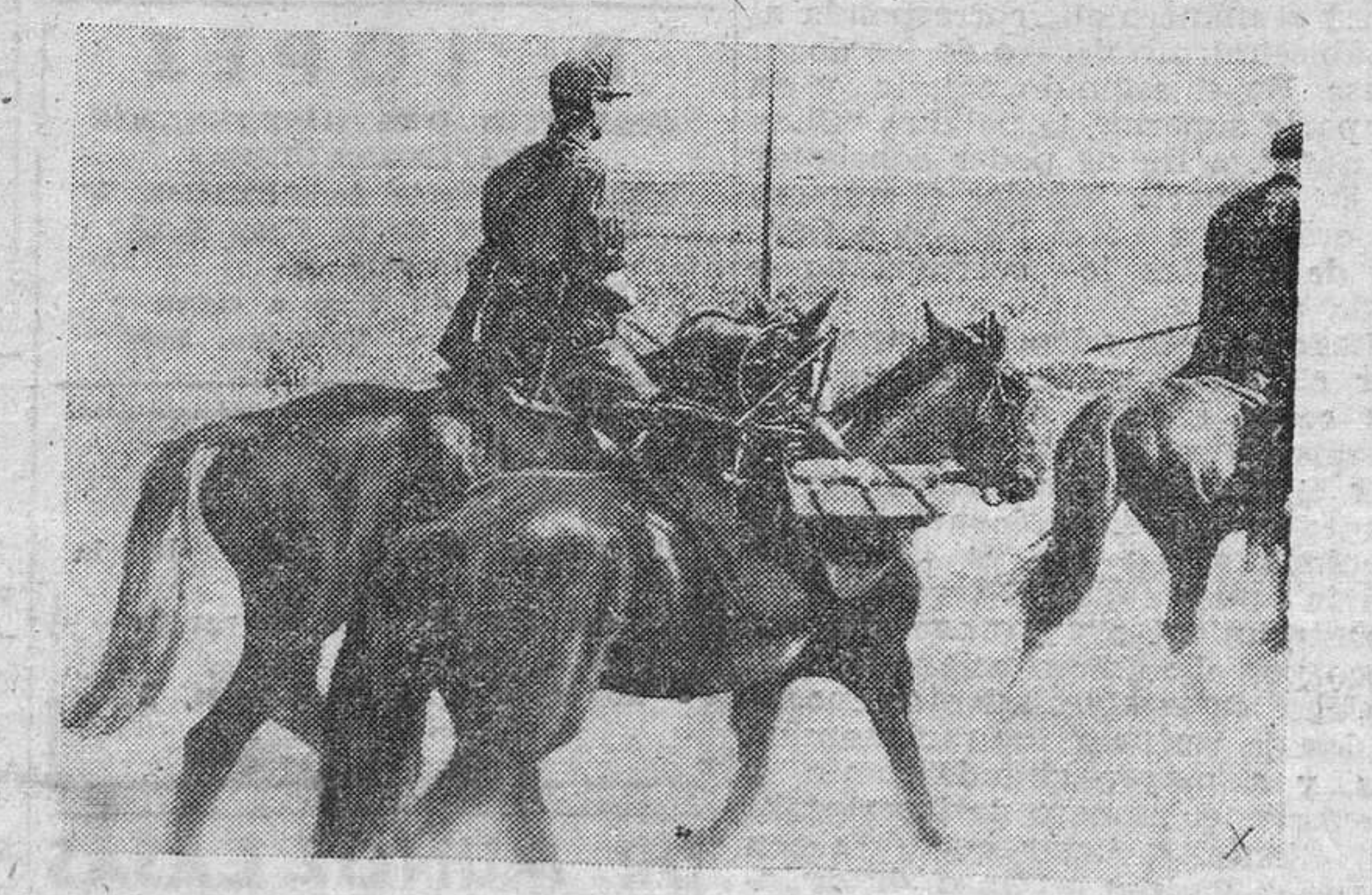
Cabalgando sobre veloces caballos, los soldados alemanes realizan en el frente del Este y sobre la marcha, el tendido de las líneas telefónicas, indispensables para la dirección de la guerra