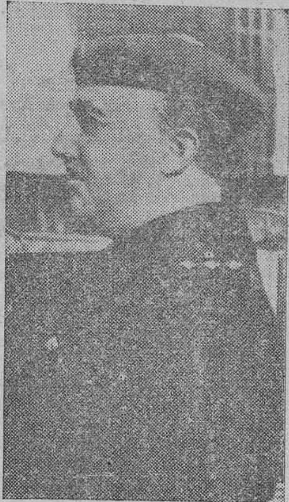
que os sigue con firme voz. ¡Arriba España! ¡Viva Franco!

Sea bienvenido, Señor, a la patria del Cid y recibir el tributo más cariñoso de un pueblo