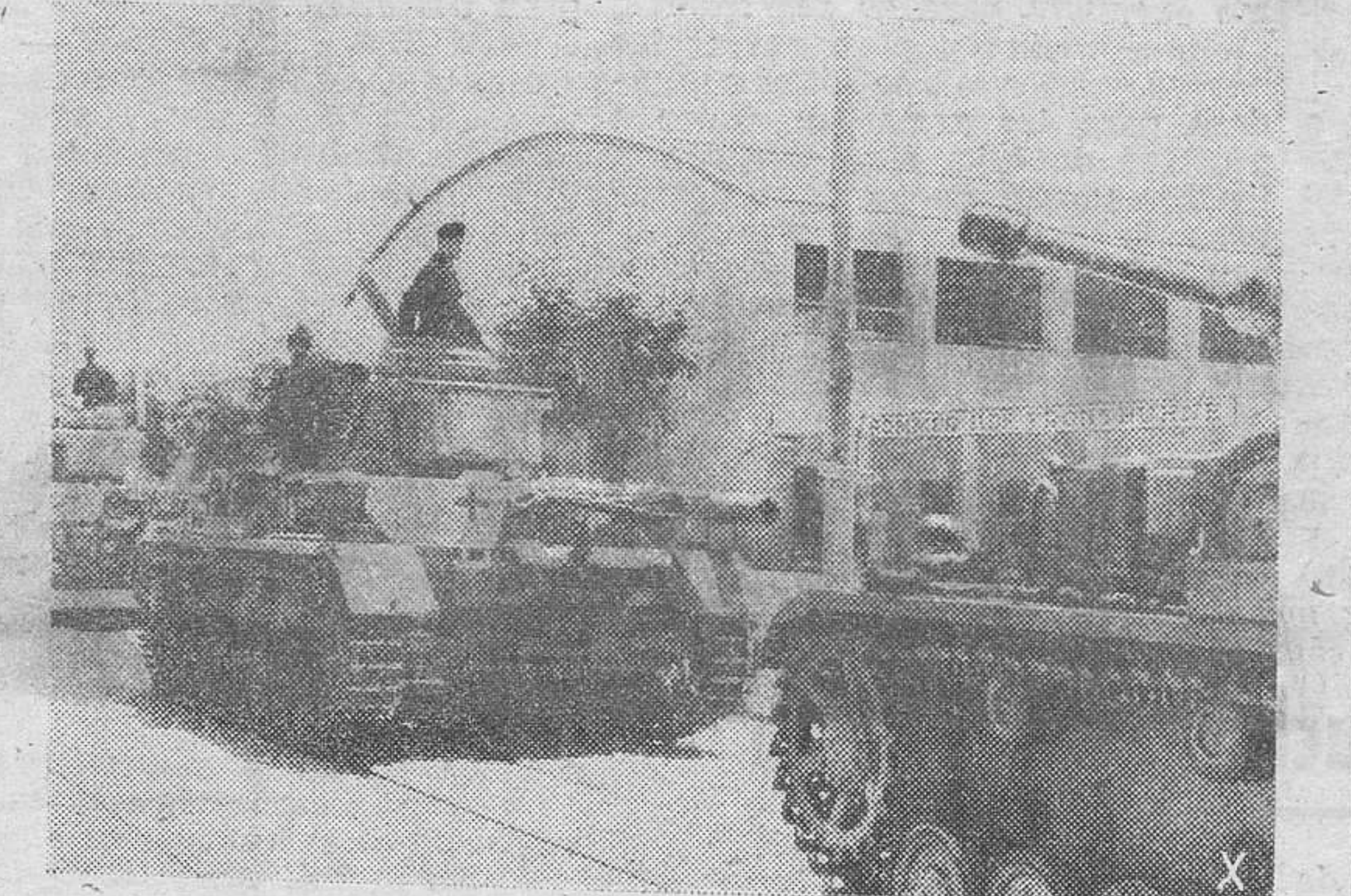
Una columna de tanques alemanes atraviesa Salónica con dirección a las costas del mar Egeo para guarnecer éstas contra posible desembarcos