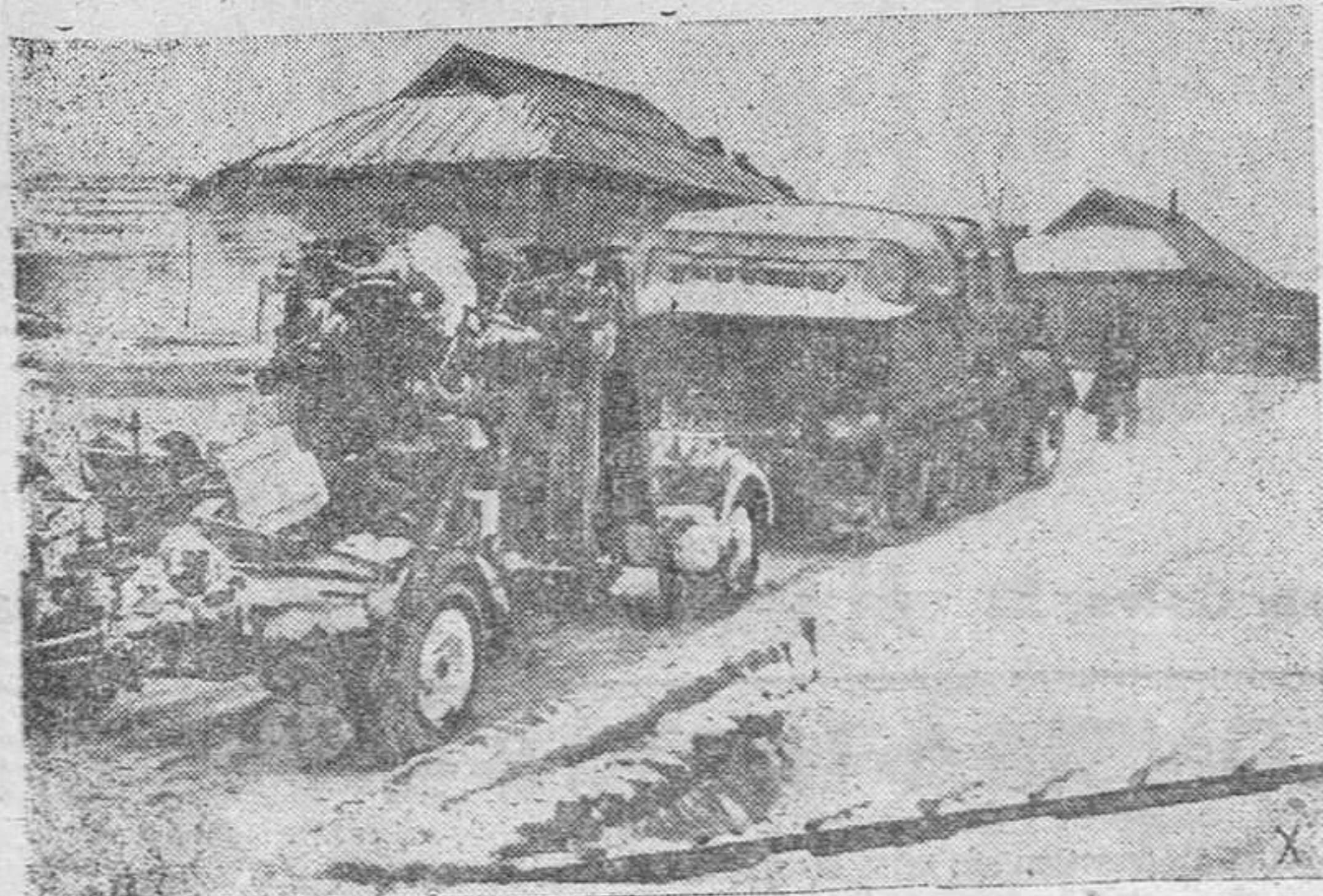
Las baterías de la D. C. A. prestan un valioso servicio en las operaciones en el frente del Este. Aquí vemos a una pieza antiaérea en marcha al sector de operaciones