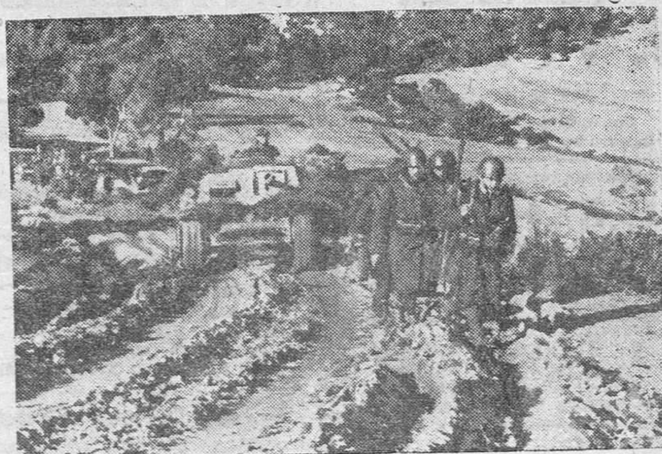
Infantería italiana y tanques alemanes se dirigen a la línea de fuego en el sector de Túnez