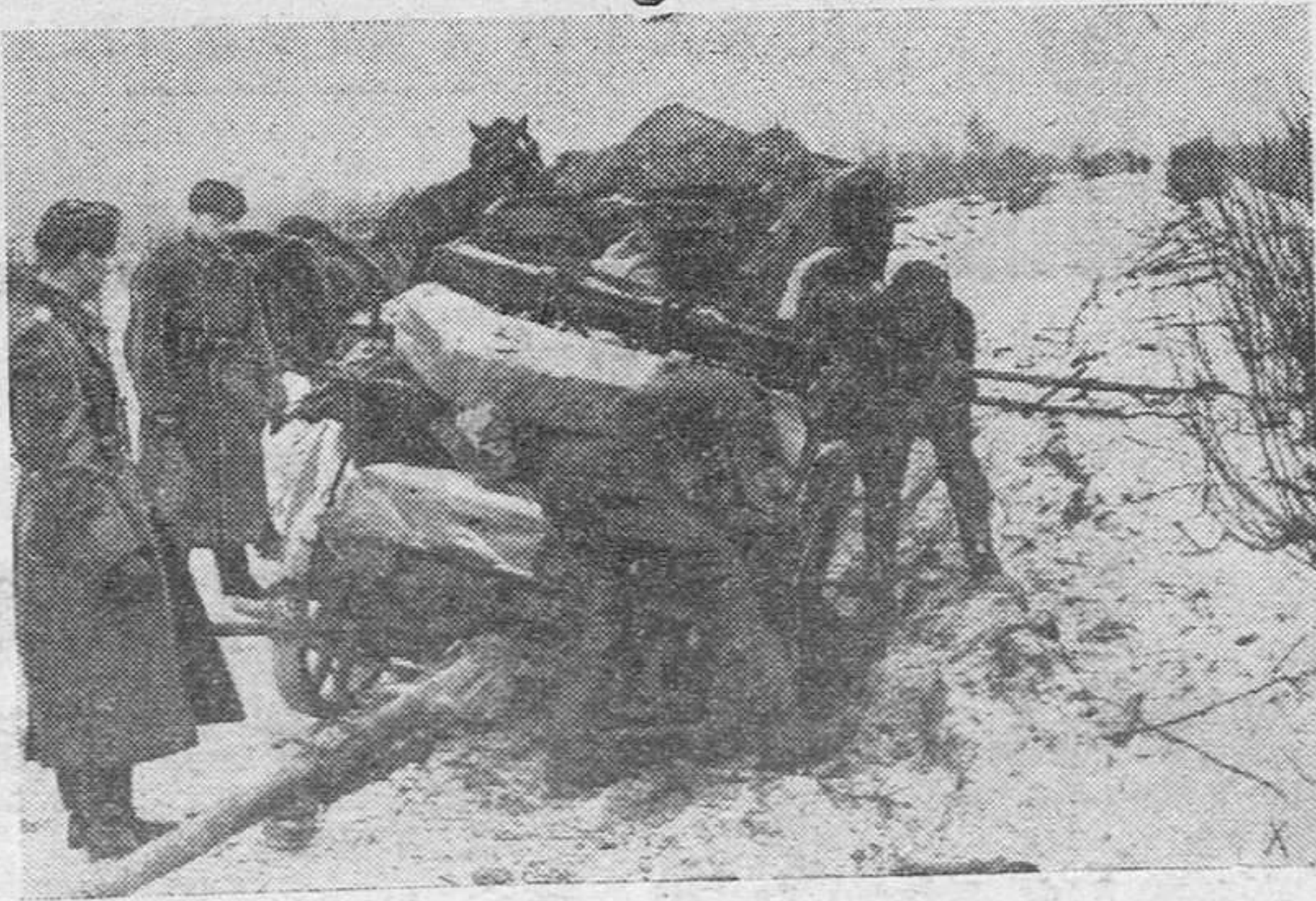
Una dificultad grave en la comunicación la constituye el temporal de nieve. Los transportes, sin embargo, se realizan a fuerza de brazos