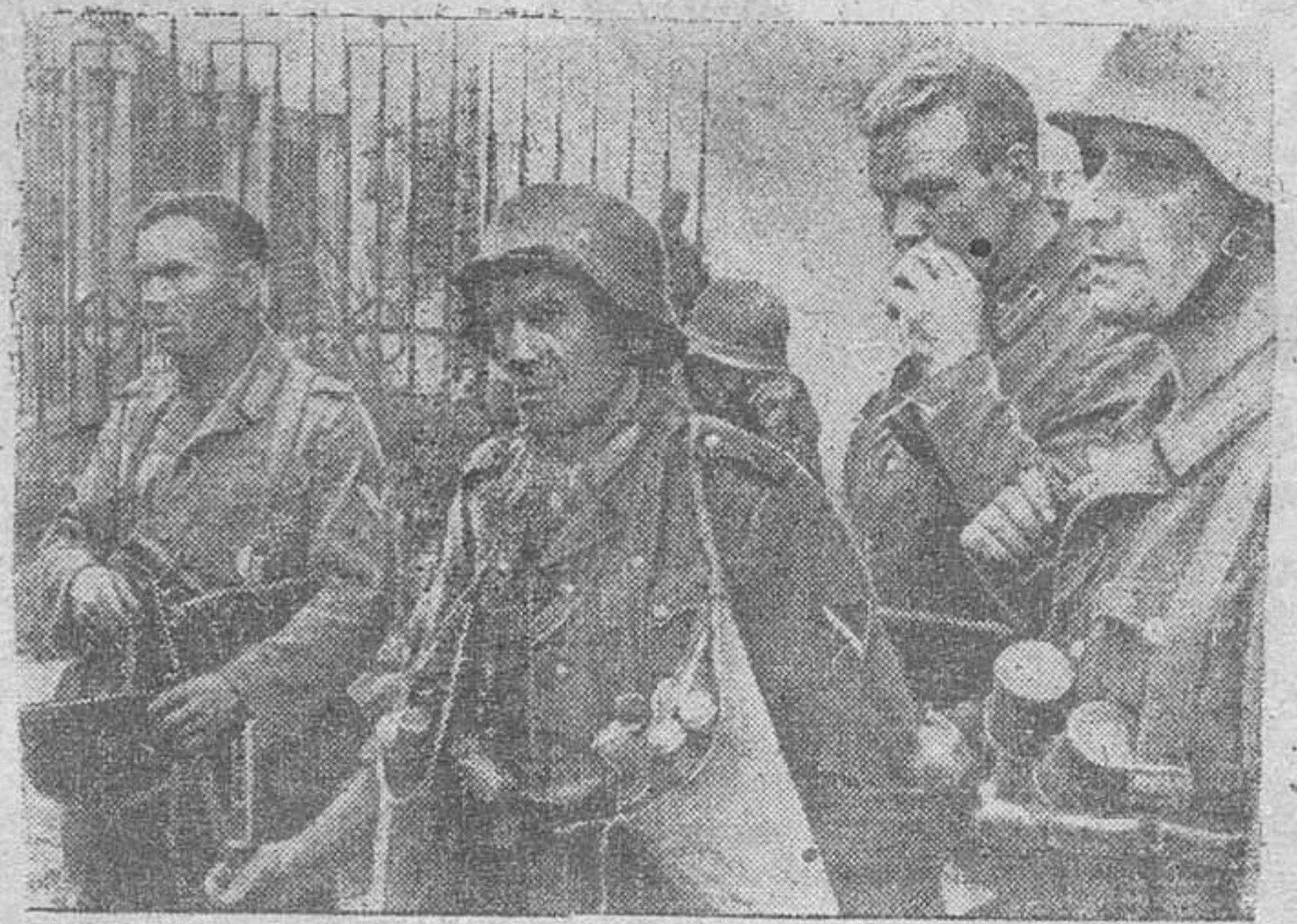
Estos soldados alemanes toman un breve descanso en el asalto a Stalingrado, pero siempre alerta y dispuestos a hacer frente a toda criminal reacción bolchevique.