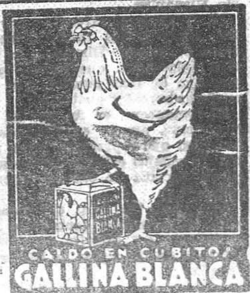
CAJADO EN CUBITO GALINA BLANCA