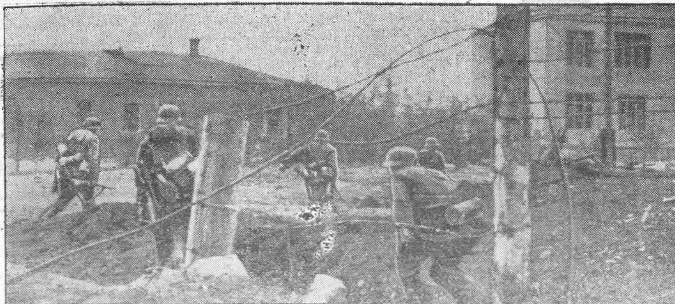
Tropas alemanas de asalto han pasado la alambrada y se dirigen a los próximos edificios donde aún se esconde el enemigo.