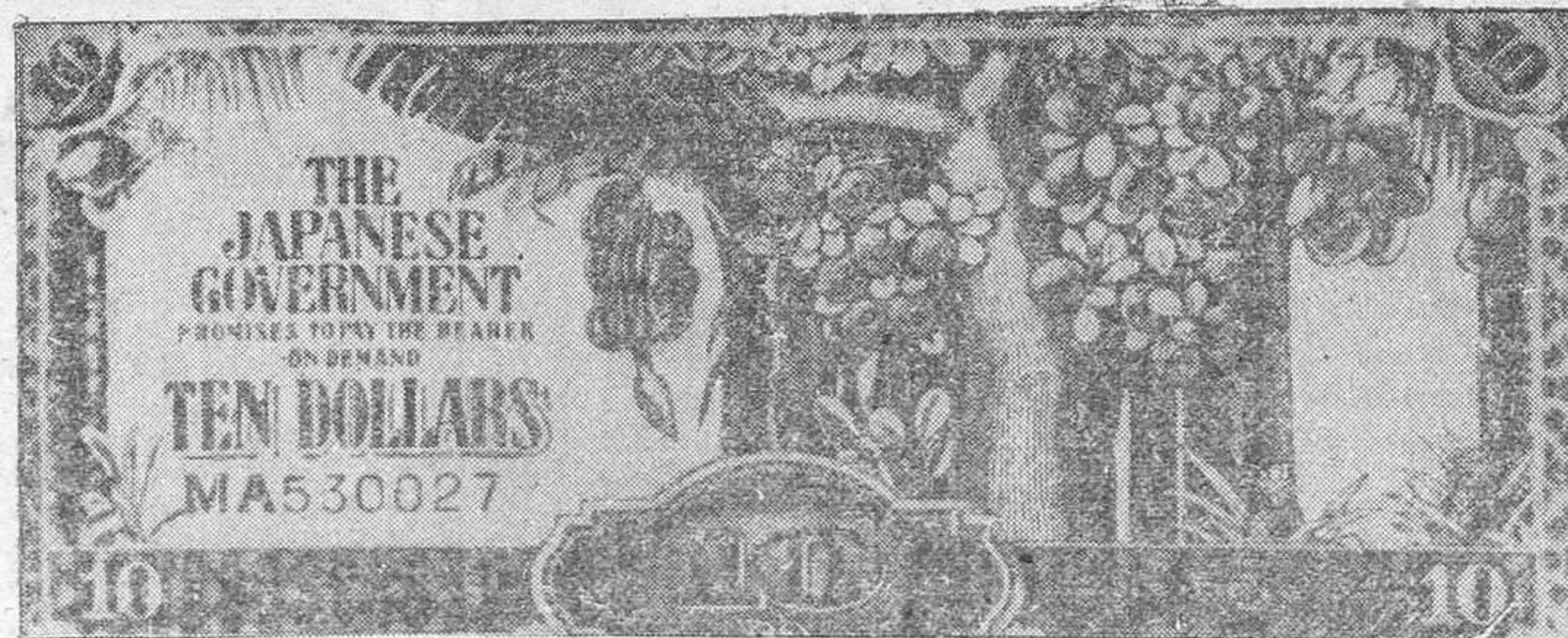
Este dinero, en idioma inglés, ha sido hecho por los japoneses para su única circulación en los territorios ocupados por éstos.