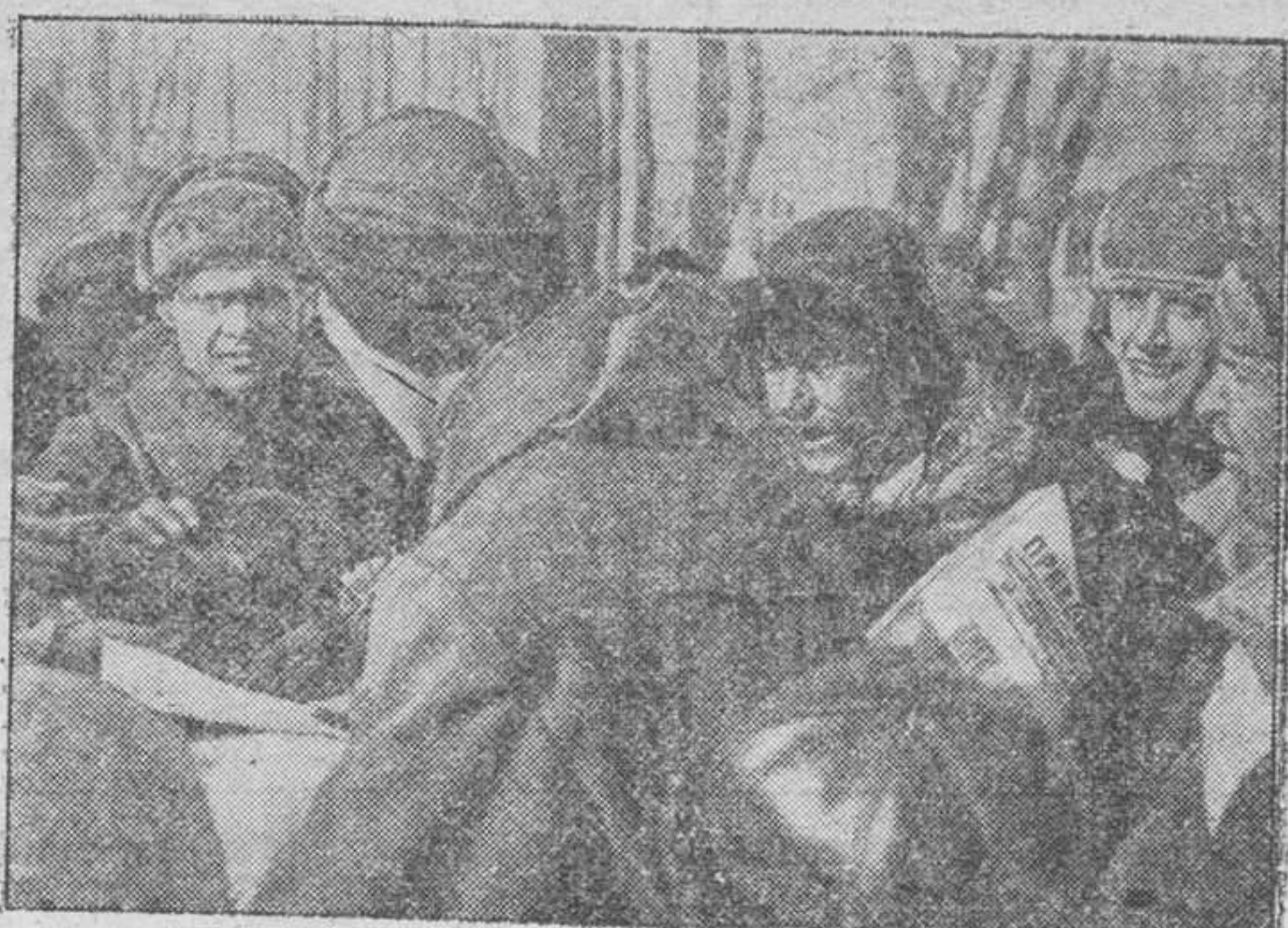
La población rusa de la zona ocupada recibe con alegría las noticias alemanas de abolición del sistema colectivista bolchevique.