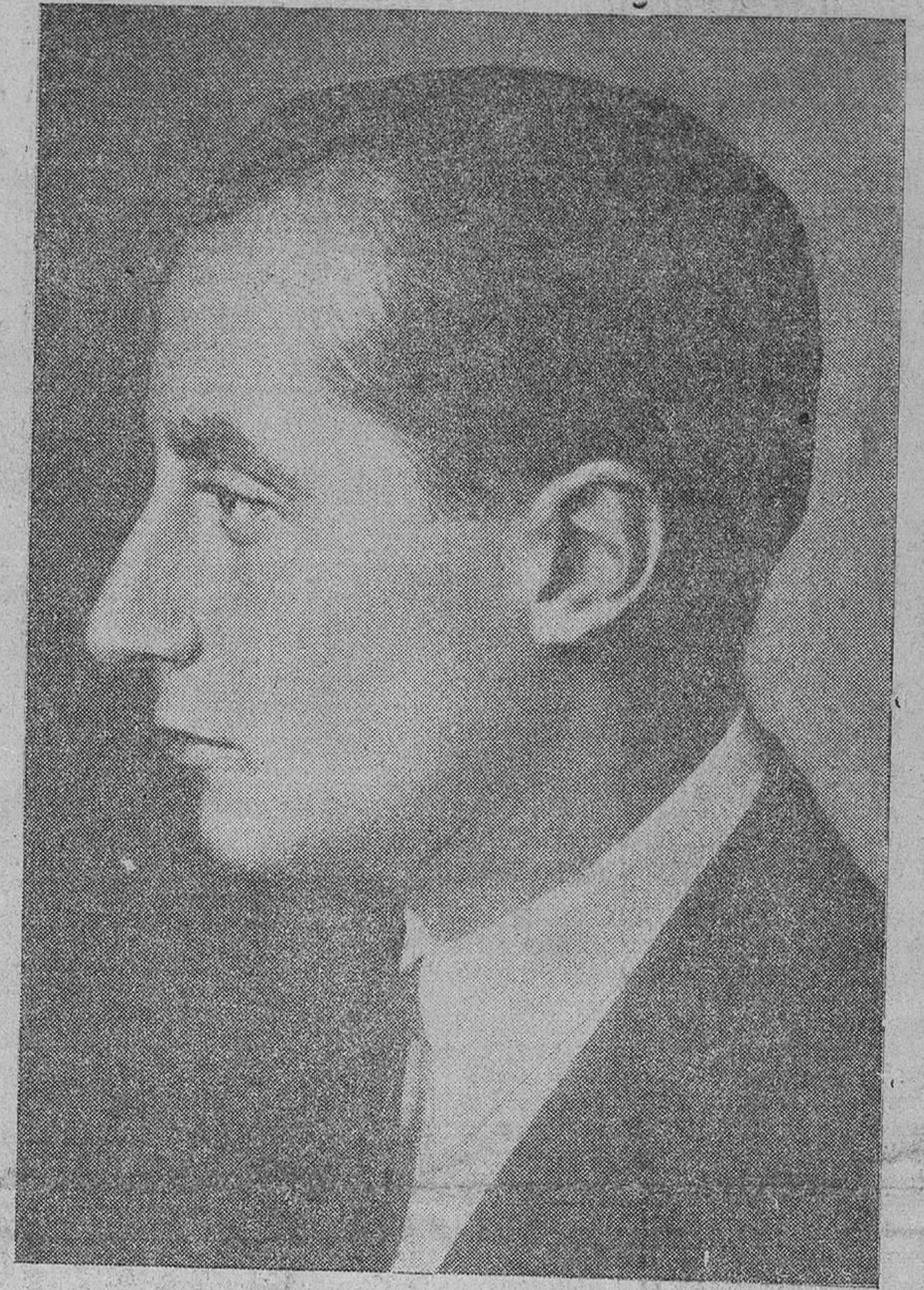
José Antonio, héroe y mártir sin par de la Cruzada Salvadora