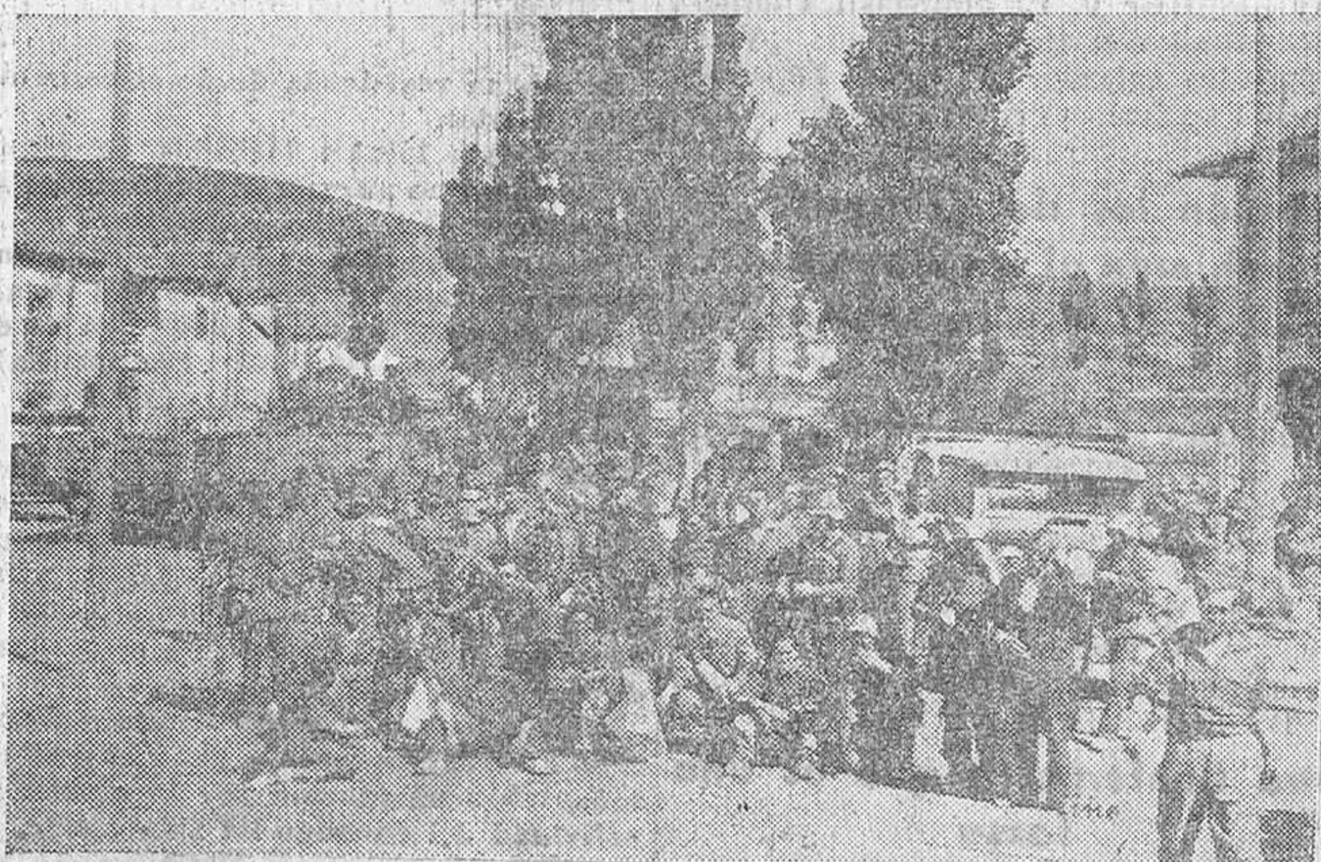
Grupo de soldados y milicianos burgaleses en Robregordo

Después de las ejecuciones relatadas, los rojos pusieron en libertad a los presos por delitos comunes, entre los que pudo salir de la cárcel la persona que nos ha hecho historia de esta horrible tragedia.