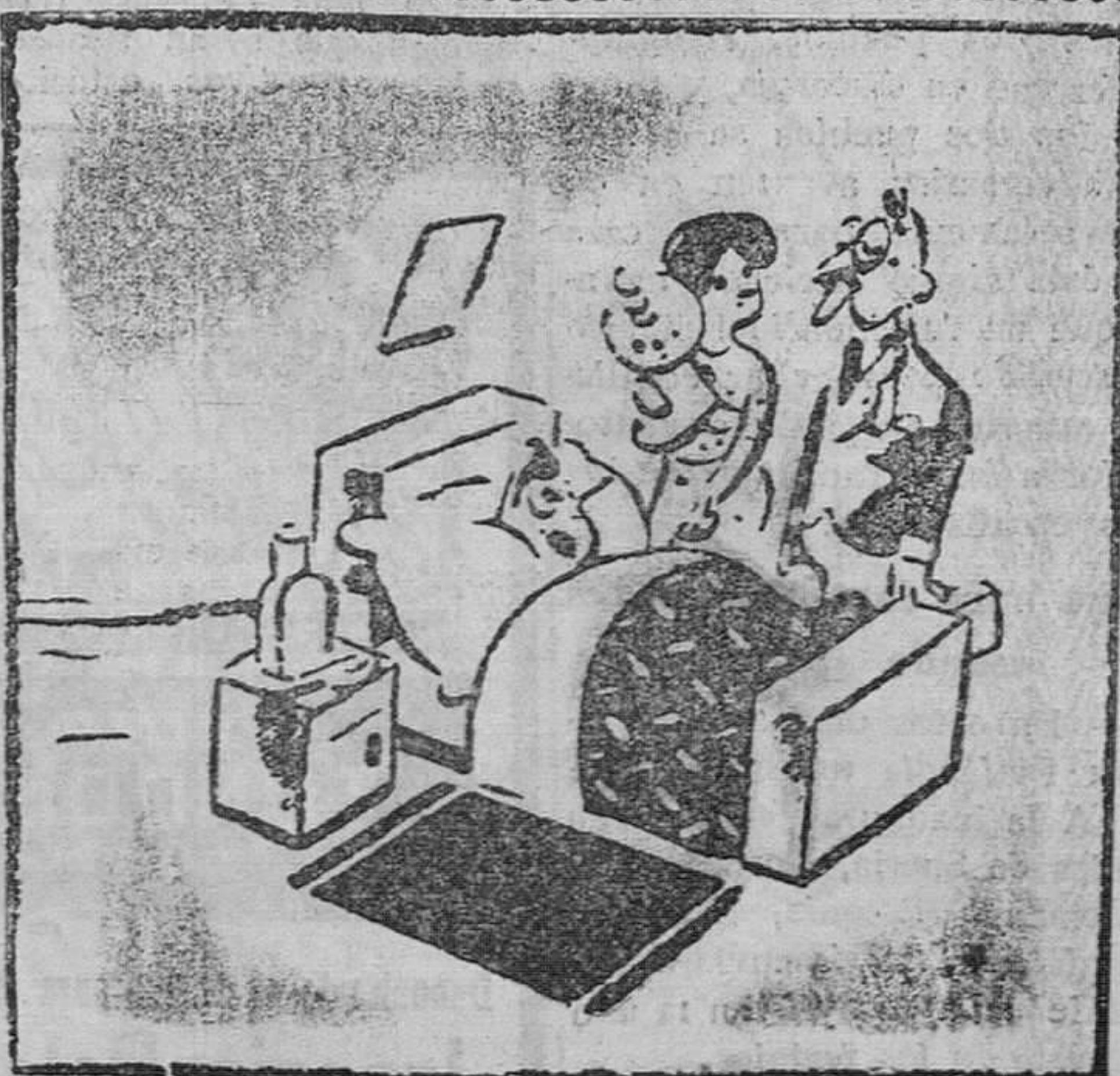
LA VISITA DEL MEDICO

—¿Le ha dado usted la medicina que le receté? —Sí. Se ha tomado 24 cucharadas en dos horas. —Pero si yo dije dos cucharadas en 24 horas.