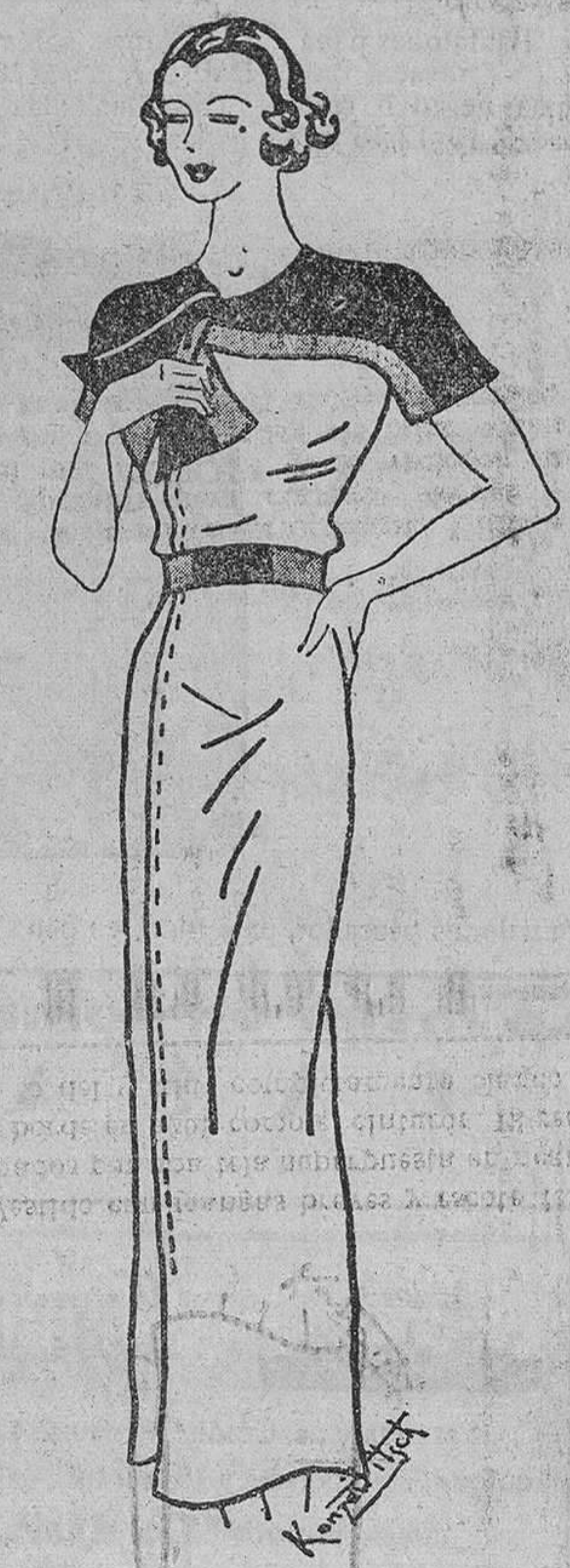
Vestido con mangas breves y escote formado por una tela superpuesta en negro y borde en azul, como el cinturón. El resto del vestido completamente blanco