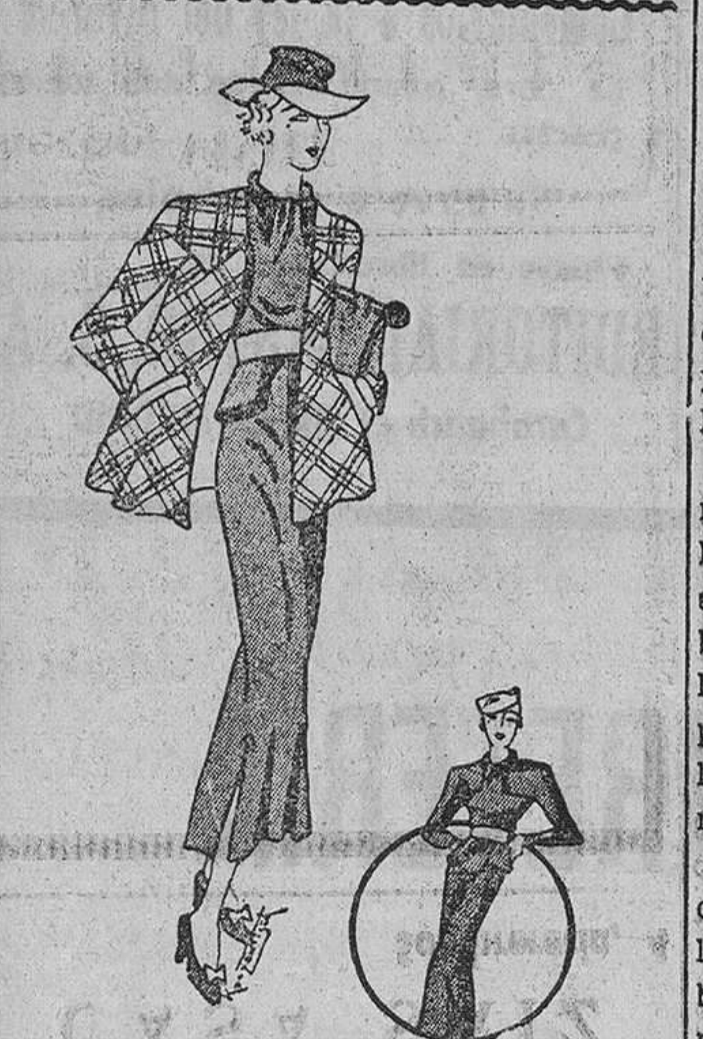
Vestido para el día en lanilla azul con cinturón de cuero blanco y chaqueta de lana con colores lineales

...los vestidos de noche de crespón, con estampados de tulipas blancos y rosa, sobre un fondo oscuro. Las mangas son anchas.