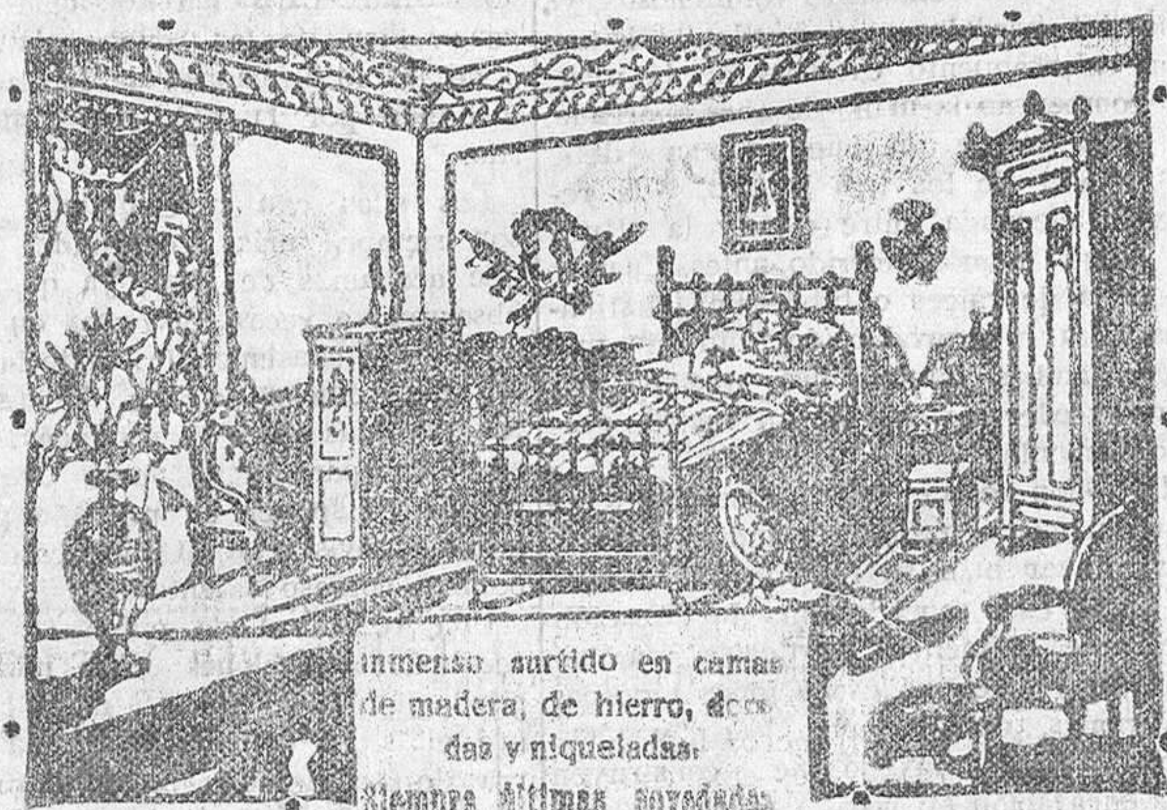
inmenso surtido en camas de madera, de hierro, de acero y níqueladas. Siempre últimas novedades.