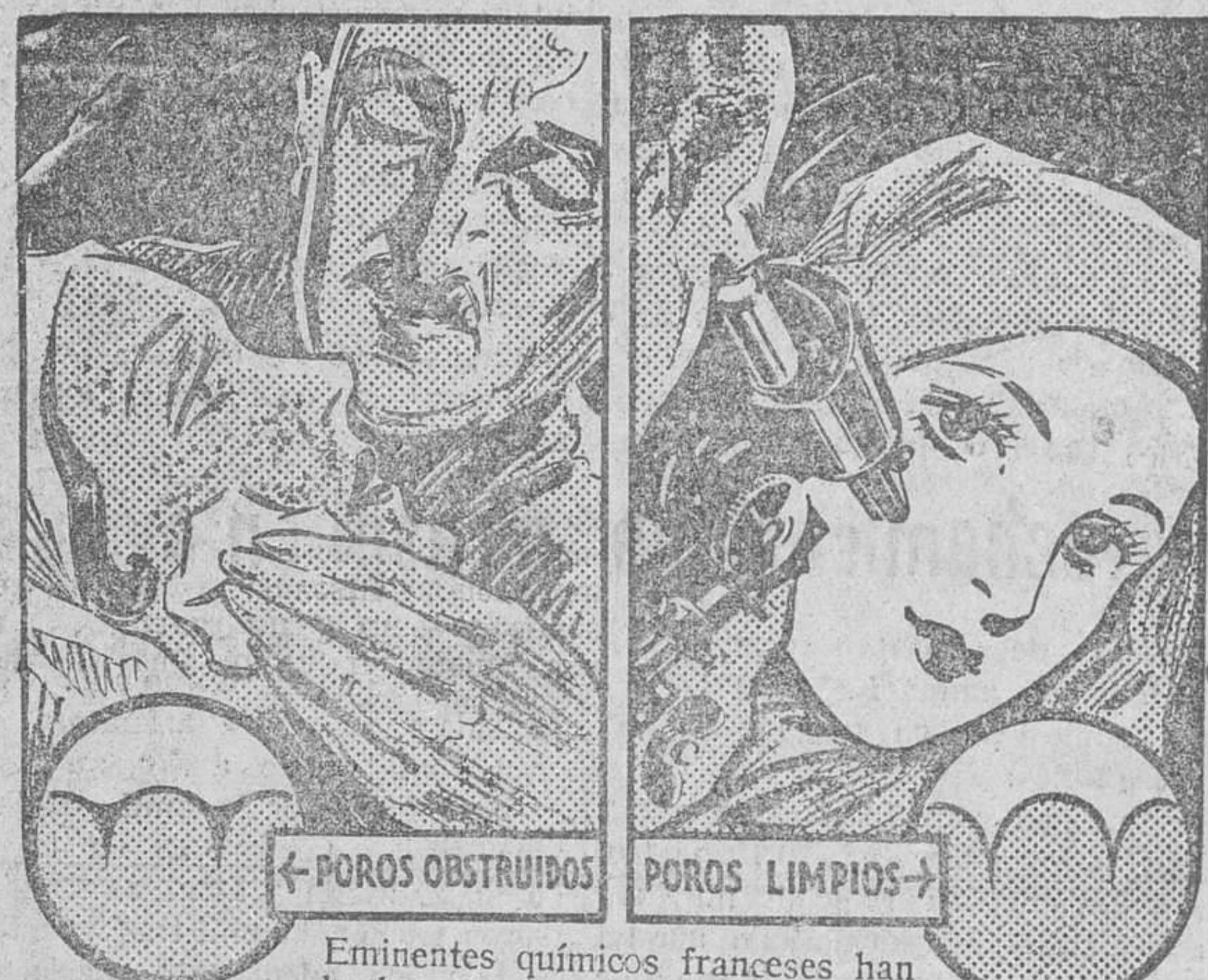
← POROS OBSTRUIDOS POROS LIMPIOS →

exenta de Espinillas y de Poros Dilatados