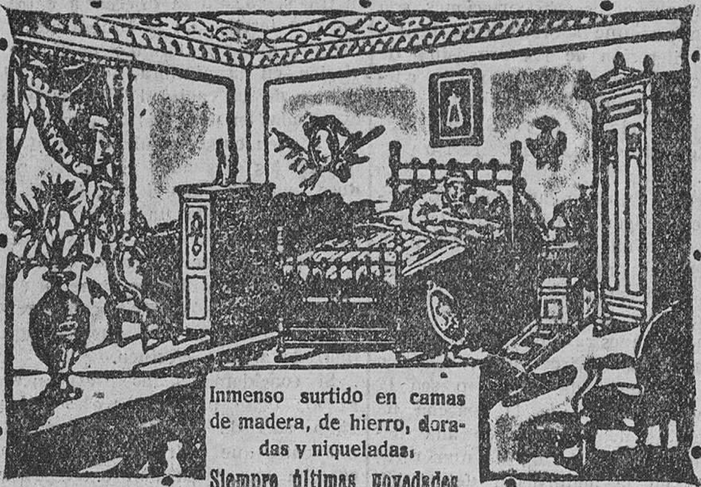
Sea el nuevo sommier, todo nuevo modelo patentado. Es muy limpio, fortísimo y muy económico.

Inmenso surtido en camas de madera, de hierro, doradas y niqueladas. Siempre últimas novedades.