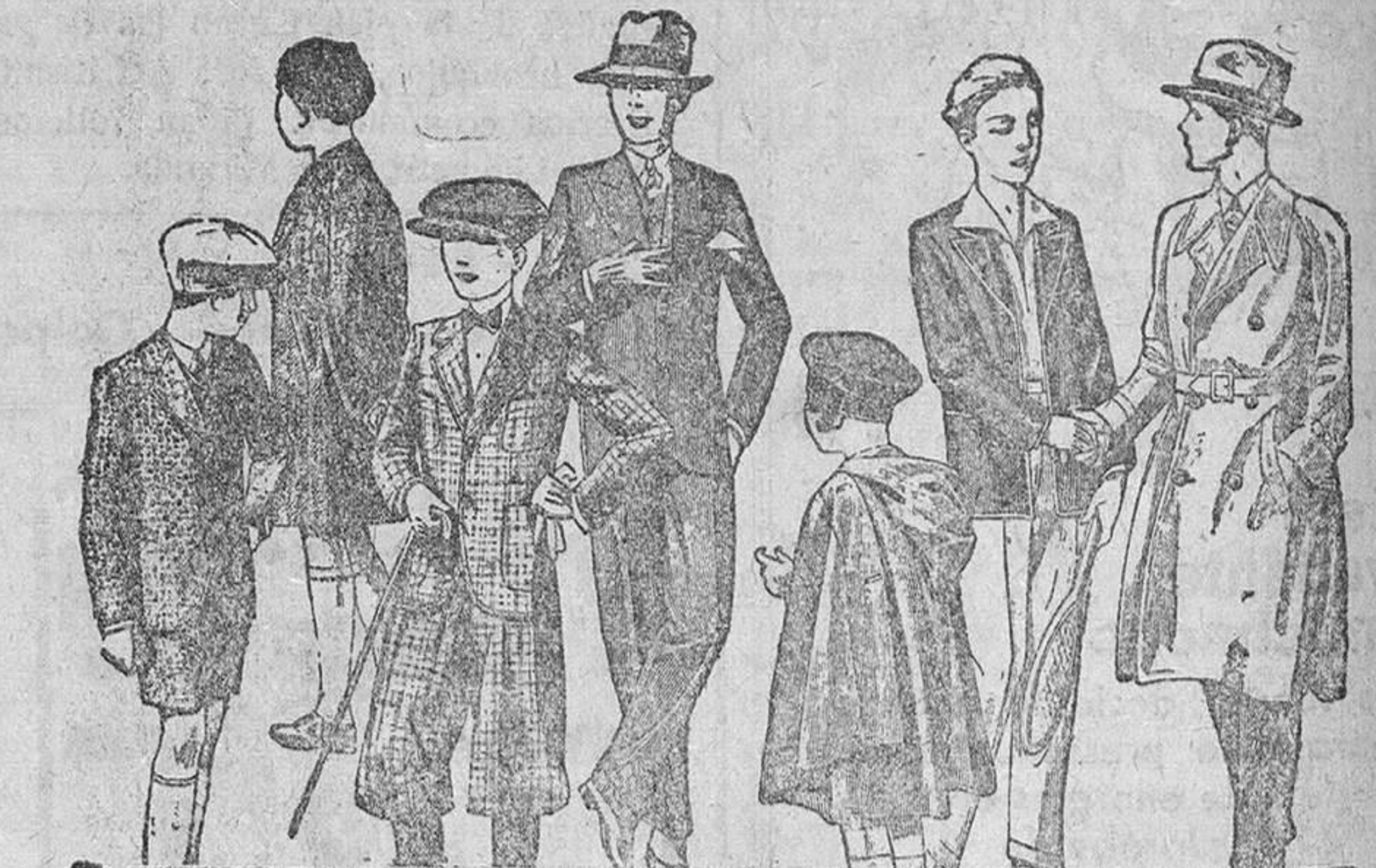
Abrigos y trajes de paño, modelos nuevos de 20, 25, 30, 35, 40 y 50 pesetas