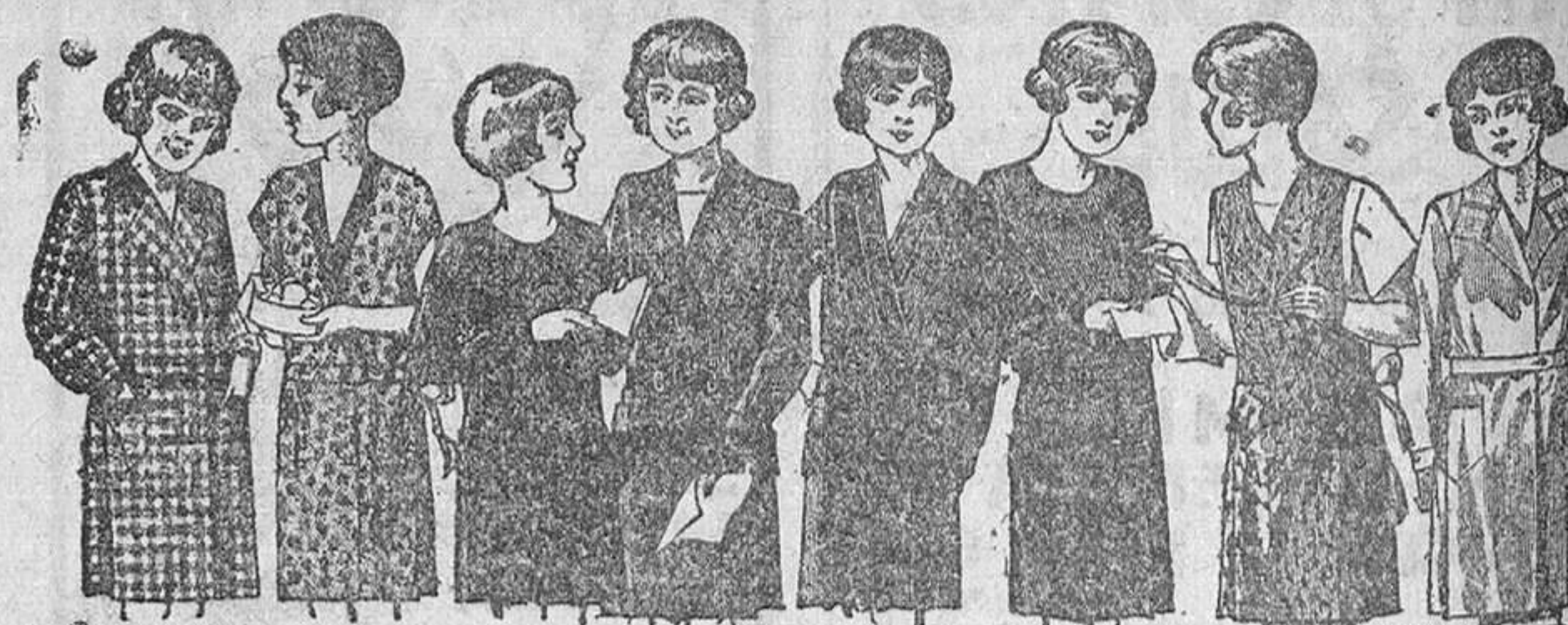
Vestiditos para niñas de 8 a 14 años, en crepón, seda o lana, de 12, 15, 18, 20 y 25 pesetas.

La Casa que más surtido presenta y más barato vende