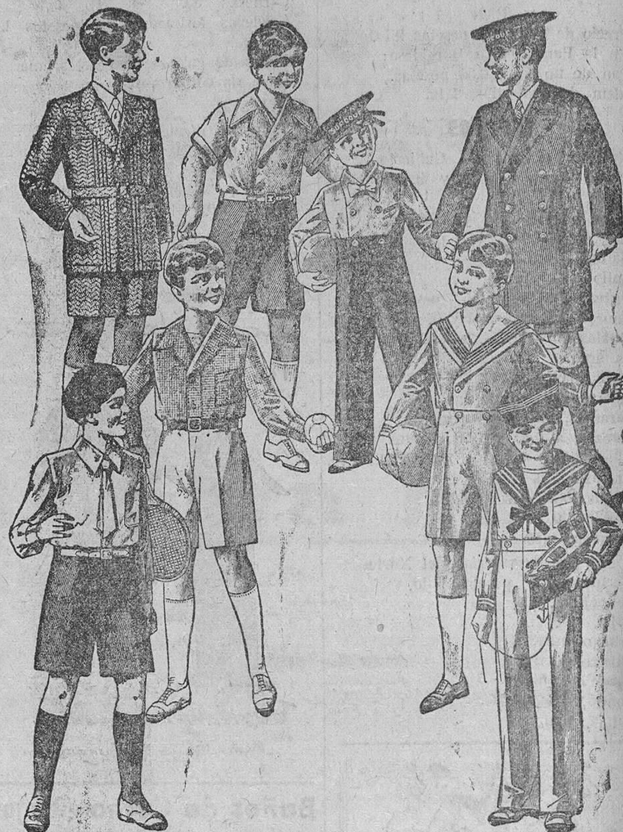
Trajecitos, modelos novedad de 15, 18, 20, 25 y 30 pesetas

Primera casa en confecciones para caballero, señora y niños Plaza Mayor, 42. Lain-Calvo, 9 y 11.--Sucursal: Plaza Mayor, 6, Burgos