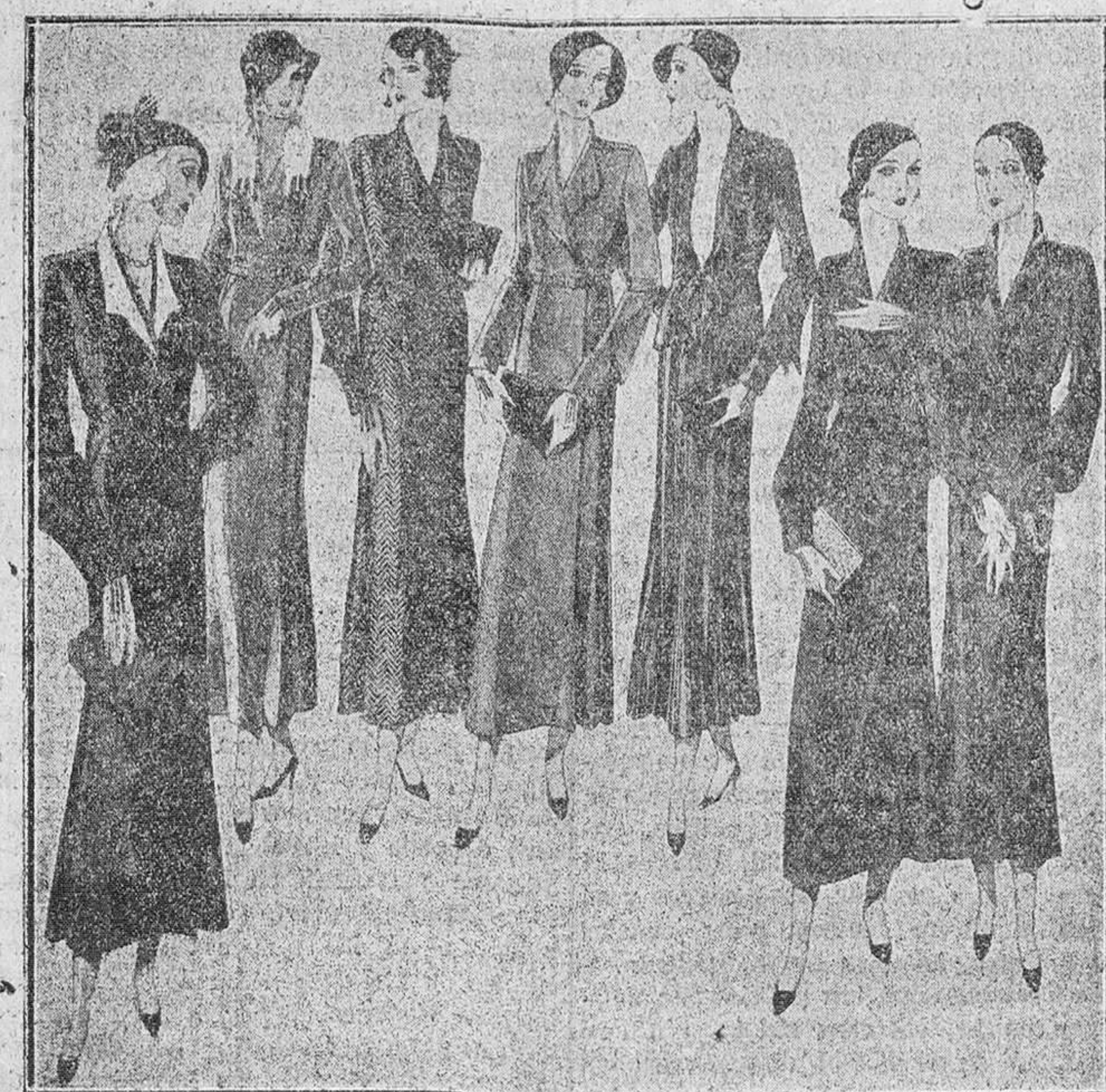
Treinta modelos distintos en abrigos gamuza de paño, colores nevedad, 30, 35, 40, 45, 50 y 60 pesetas. Con cuellos y puños de felpas novedad, 5 pesetas más.

Primera casa en confecciones para caballero, señora y niños. Plaza Mayor, 42. Lain-Calvo, 9 y 11.-Sacrasal: Plaza Mayor, 8, Burgo.