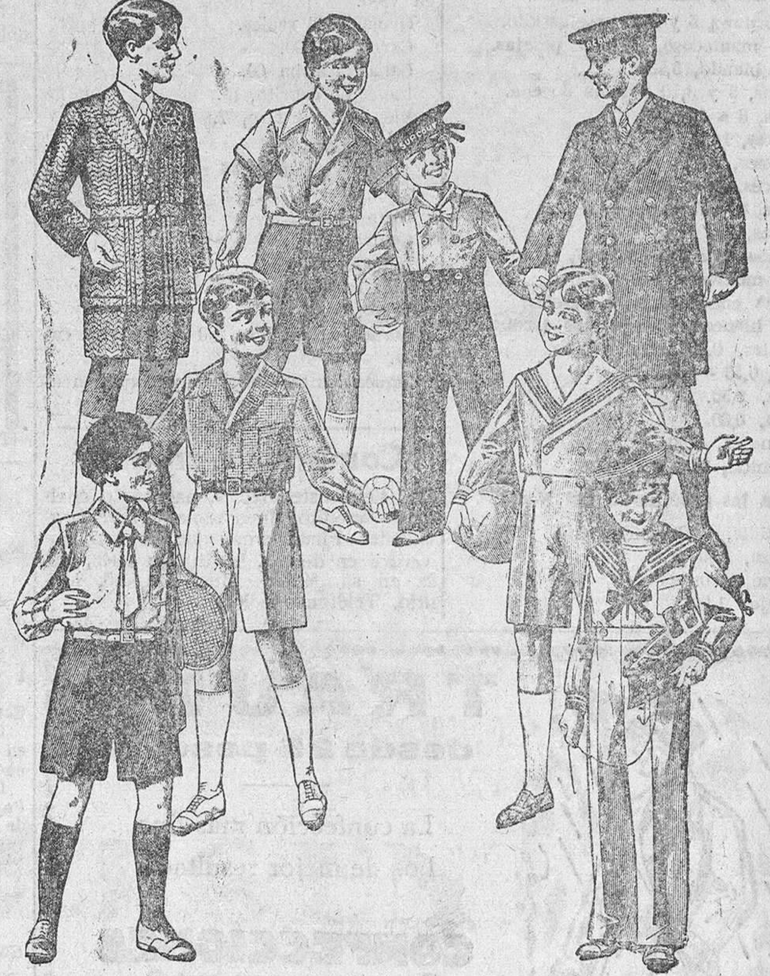
200 modelos distintos en trajecitos desde 12, 15, 18, 20 y 30 pesetas.

Primera casa en confecciones para caballero, señora y niños Plaza Mayor, 42. Lain-Calvo, 9 y 11.—Sucursal: Plaza Mayor, 6, Burgos