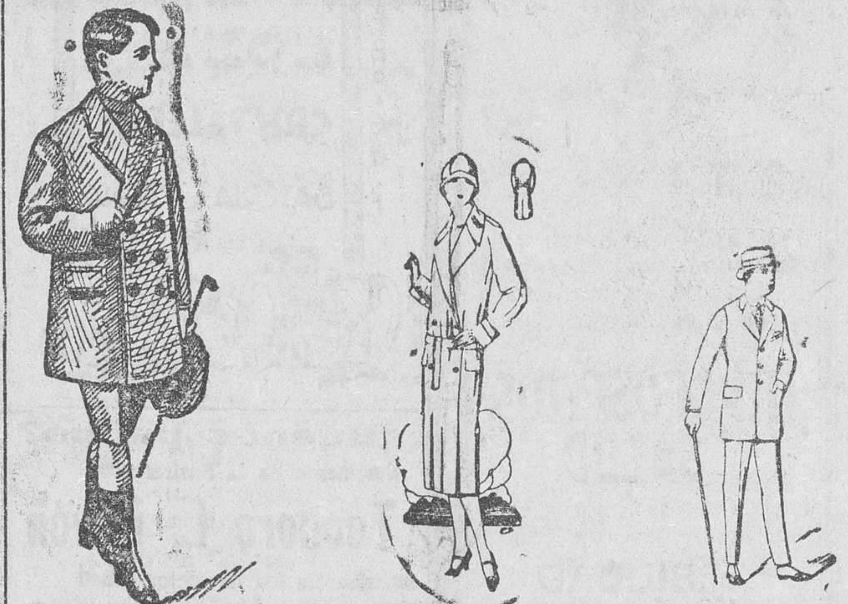
Abrigos novedad para niños, a 15, 20, 25 y 30 pesetas. Abrigos para señora corte moderno, a 20, 25, 40 y 50 pesetas. Trajes para caballero de 40 a 115 pesetas. Corte moderno.