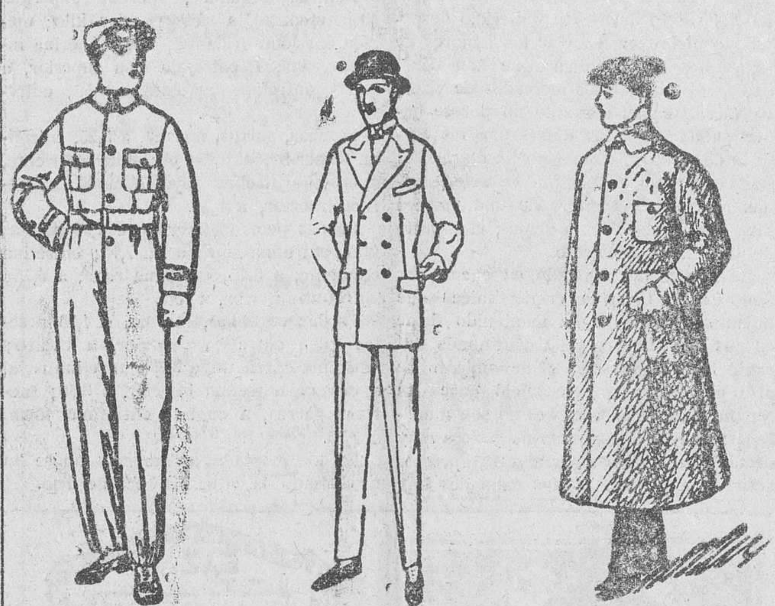
Buzos azules, color kaki y blancos, a 8, 10 y 15 ps. Trajes de confección fina, a 50, 60, 70 y 90 ps. Guardapolvos en color gris y kaki, de 7 a 20 ps.