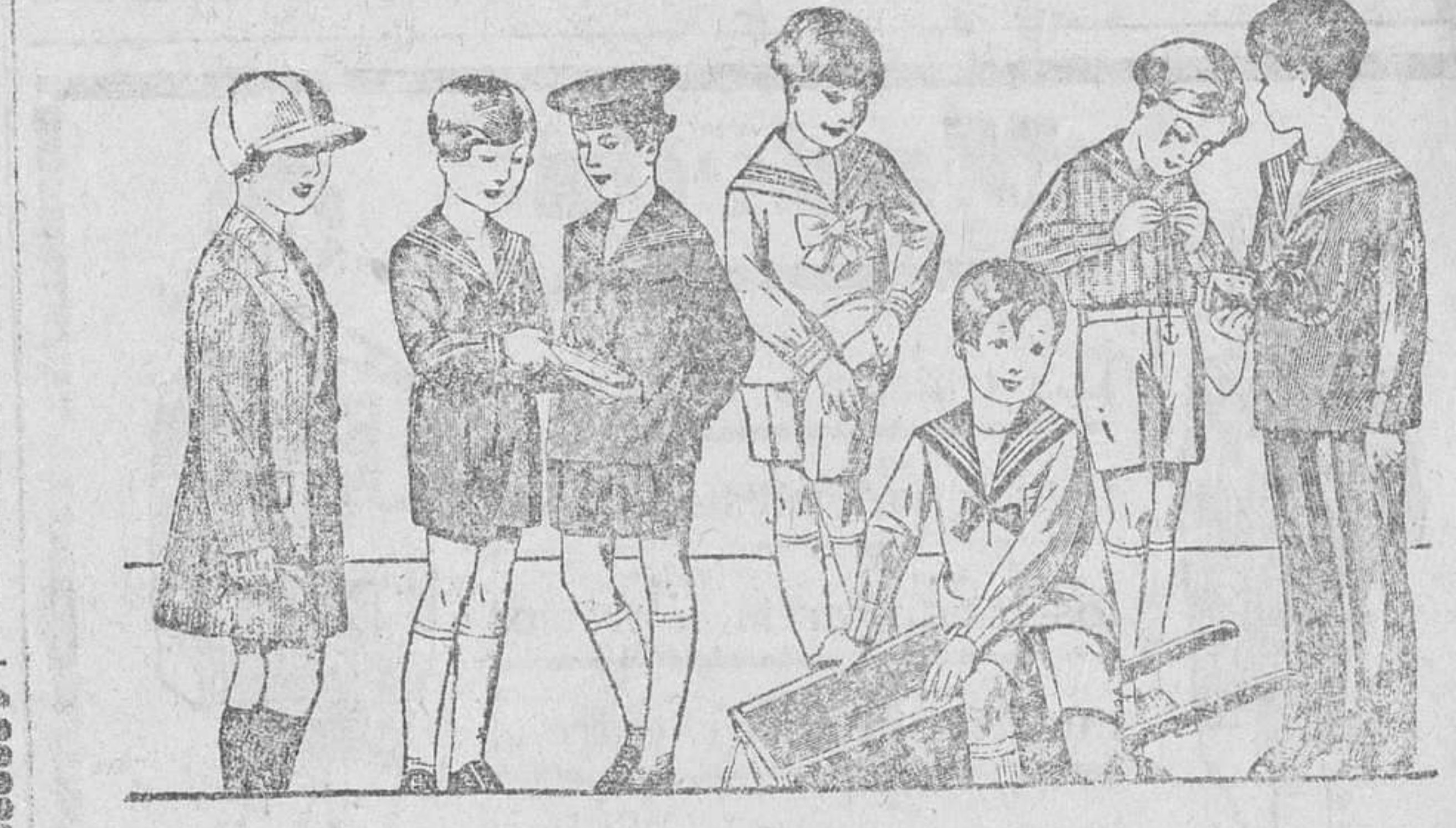
Trajectos modelos novedad, de 15 a 40 pesetas.—La casa que más surtido presenta y más barato vende. Abrigos impermeables piel de elefante, valor 125 pesetas, hoy a 30. Proveche esta ocasión única.

Siempre grandes existencias encontrarán en la Casa Munguía Plaza Mayor, 42, y Lain-Calvo, 9 y 11.—Burgos