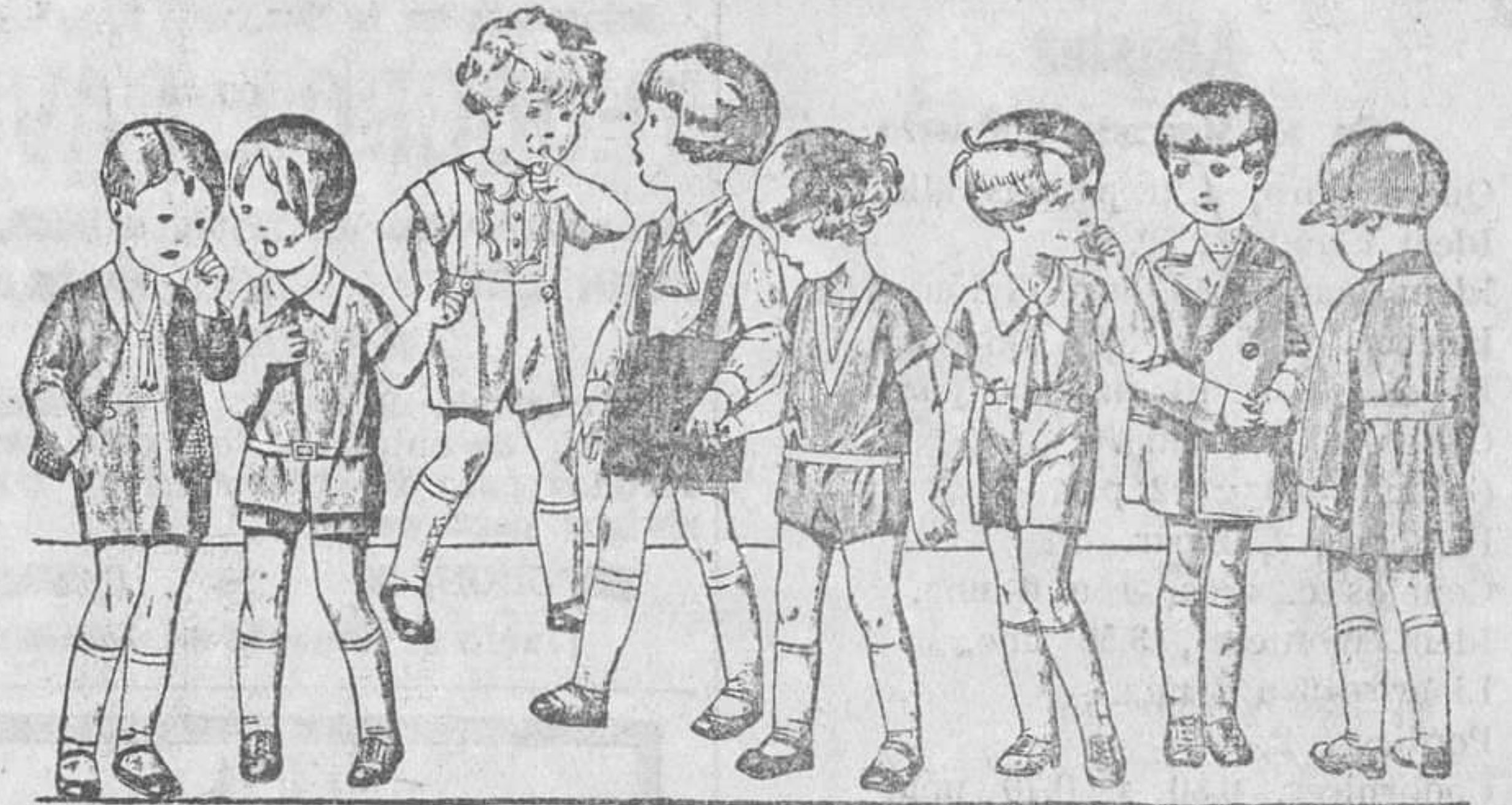
20 diferentes modelos de peles y trajecitos para niños de 2 a 5 años, en terciopelo, dril, lana y otomán, a 3'50, 4, 5, 6, 8 y 10 pesetas.

Gran casa de tejidos y ropas confeccionadas PARA CABALLERO, SEÑORA, JOVENES Y NIÑOS SASTRERIA Y PANERIA T LEPONO 603 E Establecimiento Oficial del Turing Club Español