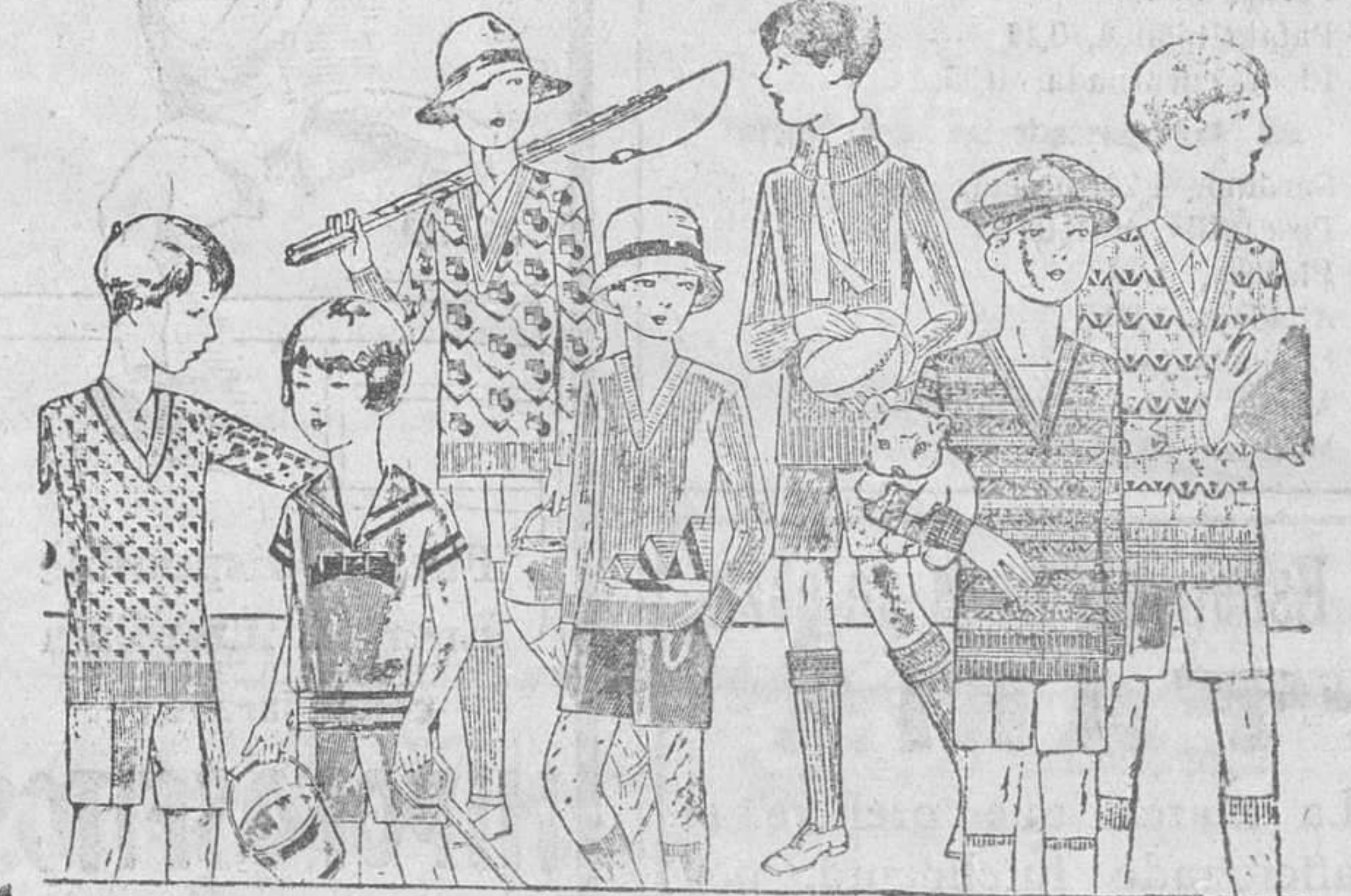
Jerseys y pullover novedad, en lana y algodón, de 4 a 10 pesetas. Modelos y colores novedad. Pantaloncitos cortos de paño, pana, dril y terciopelo.