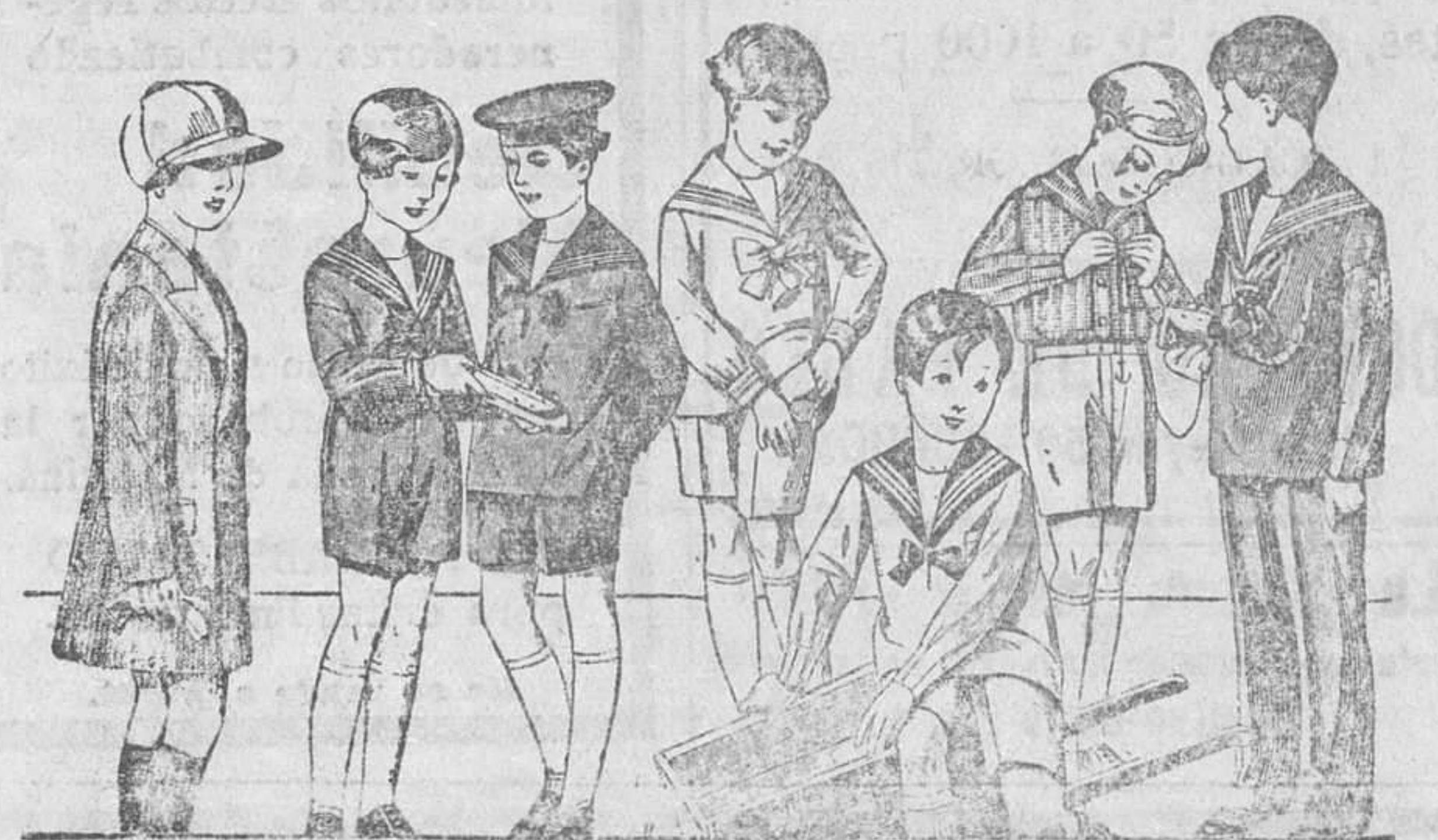
50 modelos distintos en trajecitos para niños, en jergas azules, vicuñas, pafetes y de dril en blanco y color, desde 8 a 35 pesetas. La Casa que más surtido presenta.

Siempre grandes existencias encontrarán en la Casa Munguía Plaza Mayor, 42, y Lain-Calvo, 9 y 11--BURGOS