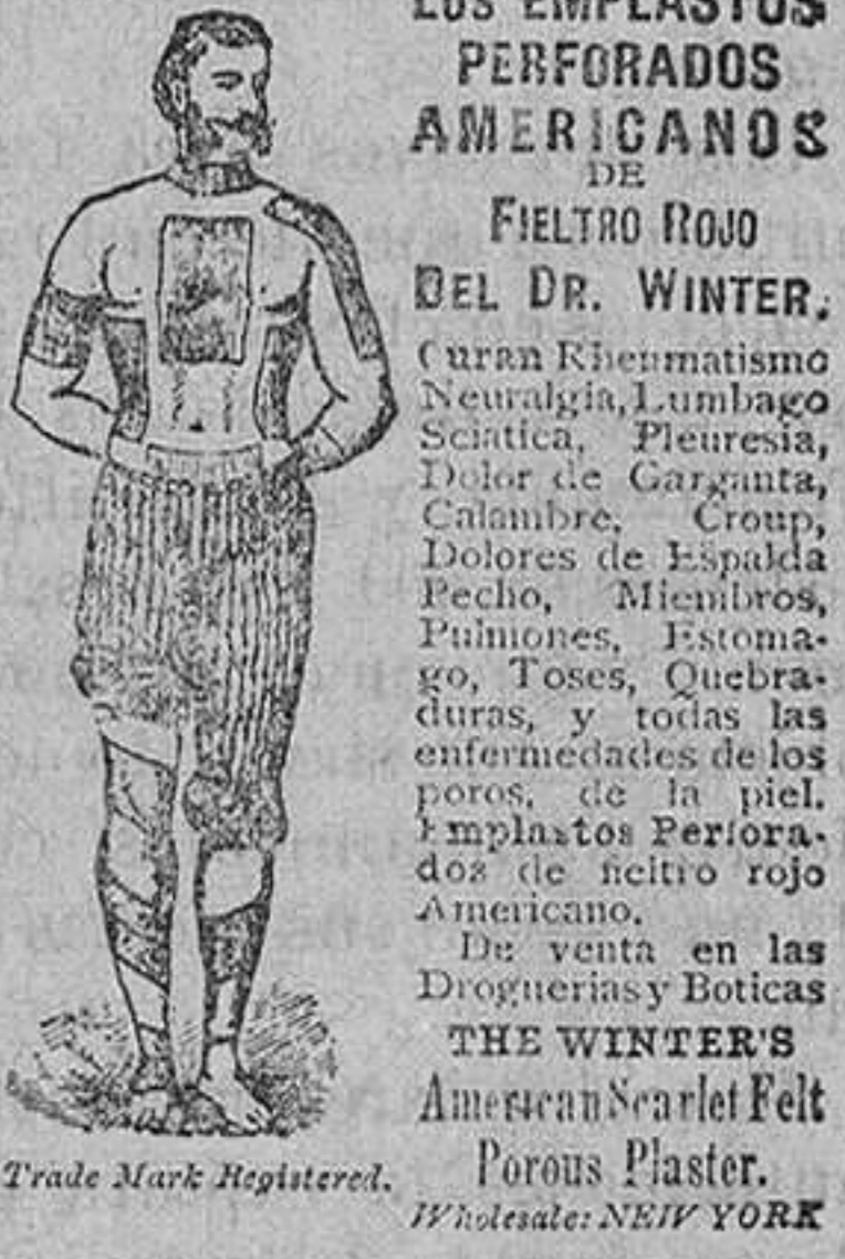
Los EMPLASTOS PERFORADOS AMERICANOS FIELTRO ROJO DEL DR. WINTER.

Se venden en las principales farmacias y droguerías.